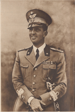
Umberto II Savoja Friedrich von Piemont, Herzog von Italien von 1938 Generalinspektor der italienischen Oberkommandierenden der Heeresgruppe Nord. S. A. R. et J. Humbert de Savoie, Prince de Piémont, lieutenant de la Couronne d'Italie, inspecteur général de l'infanterie et chef des armées du Nord.