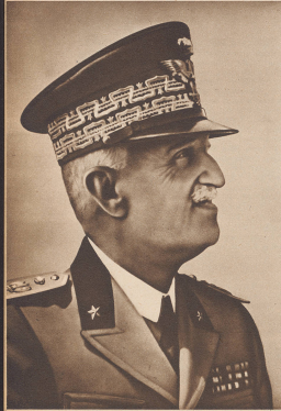
Viktor Emanuel III. König von Italien und Kaiser von Äthiopien, ab 1929 Befehlshaber aller italienischen Land-, See- und Luftstreitkräfte. S. M. Victor Emmanuel III, roi d'Italie et empereur d'Éthiopie, chef suprême des armées de terre, de mer et de l'air.