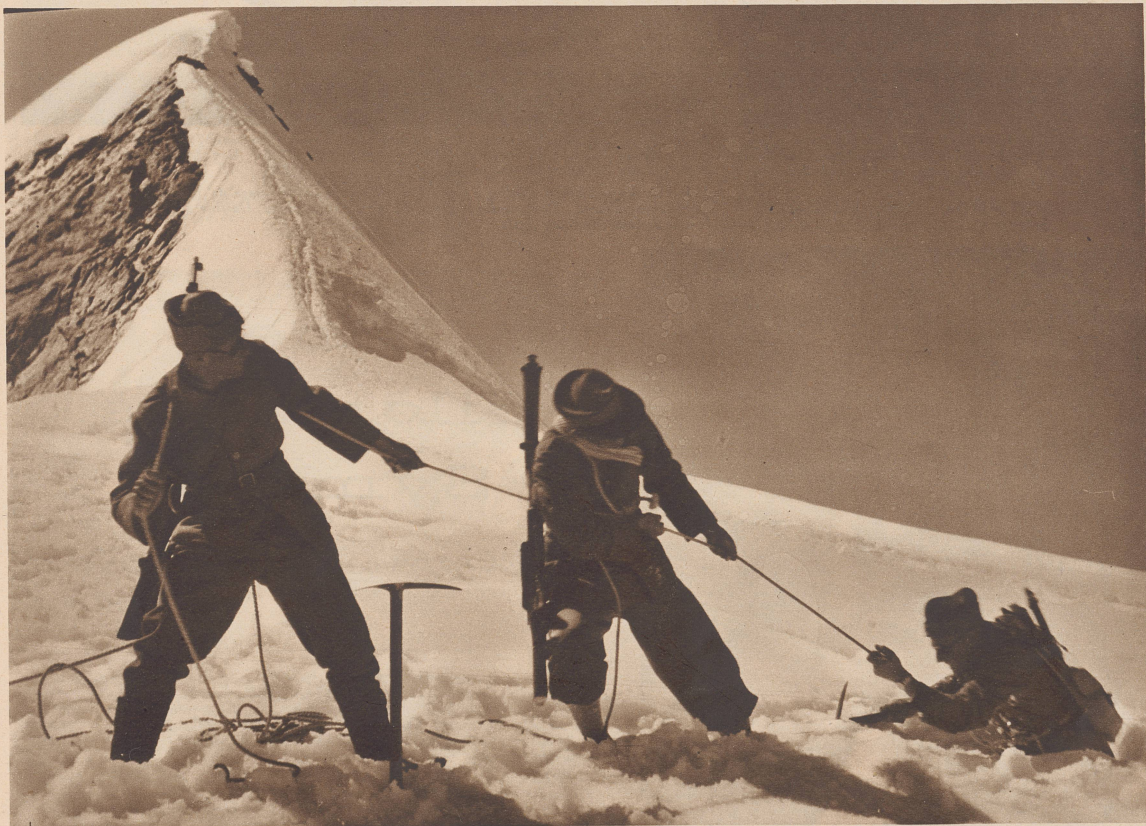
Errettung aus der Gletscherspalte. Mit vereinten Kräften befördern zwei Mann einer Seilschaft ihren plötzlich in einer Spalte verschwundenen Kameraden rasch wieder ans Tageslicht.

Le sauvetage d'un homme tombé dans une crevasse du glacier de Gletsch. Tirant de toute leur force sur la corde, deux officiers sortent de sa fâcheuse position leur camarade disparu dans une crevasse.