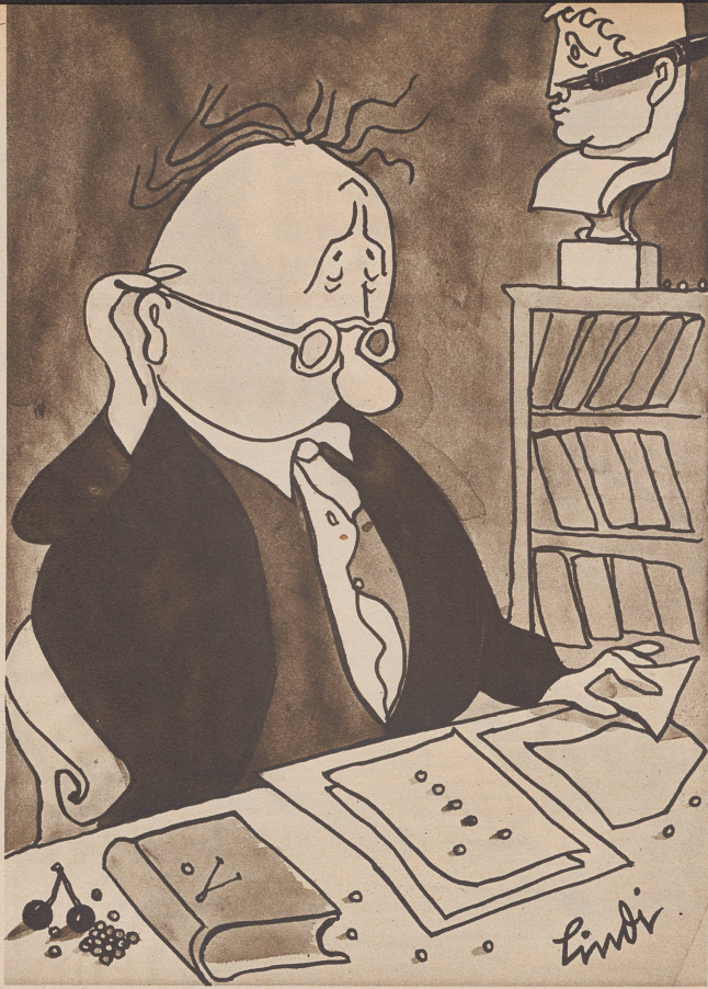
Der Professor. «Eigenartig, einen Moment — mein Stylo war doch eben noch hinter dem Ohr...» — C'est incroyable, il me semblait avoir mis mon stylo à l'oreille.

«Keine Spur, ich leiste mir nur eine kleine Arbeitspause. Ich bin nämlich von Beruf Komiker.»