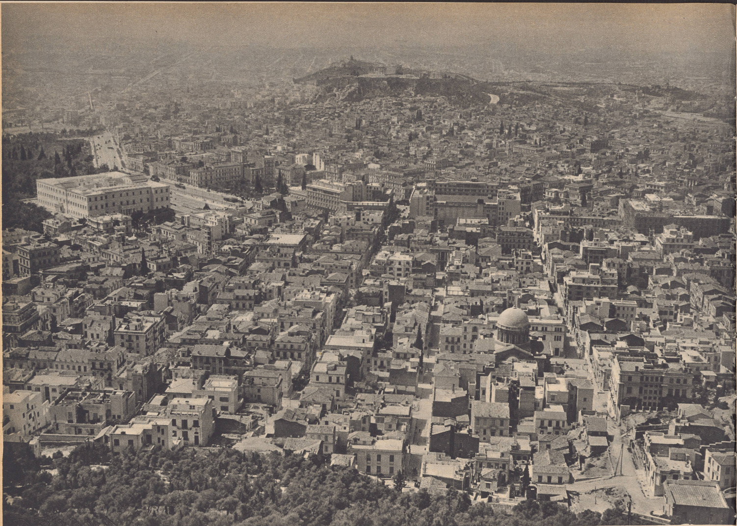
Blick auf Athen, die Hauptstadt Griechenlands. Links der Königspalast, im Hintergrund die Akropolis. Athen hat mit allen Vorstädten eine halbe Million Einwohner. Bis jetzt ist die Stadt von italienischen Fliegerangriffen verschont geblieben. Athènes, capitale de la Grèce, compte 500 000 habitants. Sur la droite, on aperçoit le palais royal et à l'arrière-plan: l'Acropole.