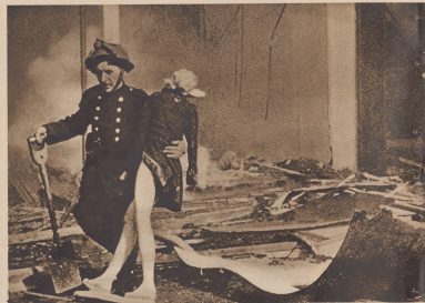
Ein Londoner Feuerwehrmann trübe bei Räumungsarbeiten in einem Wachenhaus eines Mannes. Die Kladderpoppe schreit ihm rettungswillig, und er antwortet in eine bessere Umwelt. Dans l'un des débris d'un magasin de Londres, se pomper à découvrir un mannequin qu'il apporte aussitôt loin des lieux de sinistre. Chose humaine, on dirait que ce mannequin lui en a de la reconnaissance.

Ein Freund von mir ging an einem Haus vorbei, dessen Vorderfront in die Luft geblasen war. Ein junger Mann und eine junge Frau standen drin und lachten. Als sie merken, daß mein Freund sie verwundert betrachtet, erklären sie: «Wir hatten eine Menge schönerer Möbel zerbrochen, und sie sind nun alle hin. So können wir von vorn anfangen. Kommen Sie doch herein und trinken Sie eine Whisky mit Soda mit — sie haben den Vorratsschrank nicht kaputtgeschlagen. Ist's nicht herrlich, am Leben zu sein!»