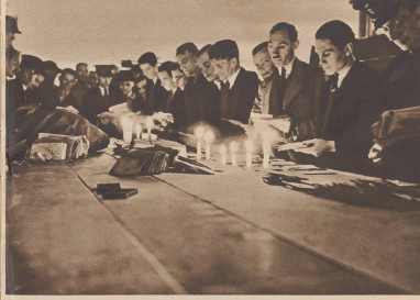
In ein Londoner Postgebäude fiel eine Bombe. Die Postbeamten konnten aus den Trümmern einen Teil der Posttaschen retten und sind jetzt daran, im Schein flackernder Kerzen die geretteten Briefschüden zu ordnen. Une bombe est tombée sur un bureau de poste londonien. Eclairés par des bougies, les employés pouvaient néanmoins calmement le tri de courrier.