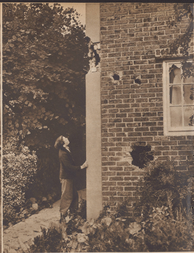
Diese Haus wurde von Schrapnellstücken getroffen. Weil nicht Schäden blühende Begleiterschüsse von Luftschiffen und, müssen sich die Unterirdische durchwegs in den Kellerräumen der Gebäude befinden. De, ébranlé contre la mort! Ceci prouve plus probable de la nécessité de se tenir à l'abri en cas d'attaque aérienne.