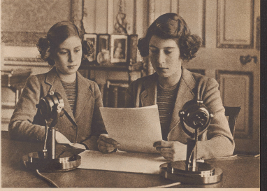
Die englische Kriegerwitwe Elisabeth spricht zum erstenmal vor dem Mikrophon. Ihre Schwester Margaret-Rose verliert mit ungestörter Aufmerksamkeit den wichtigen Vortrag. La Prisonnière britannique Elisabeth prononce pour la première fois un discours radiodiffusé. Sa sœur cadette Margaret n'en est pas moins impressionnée.