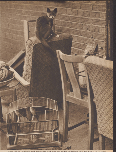
Ehemalige Fliegergriff entgangen sind hier die beiden Papageien und die Katz einer sonst schwer geschädigten Familie. Das Haus wurde von der Bombe im Innern zerstört, und jetzt steht das auch die Katastrophe unvorstellbar geliebte Mobiliar auf der Straße. Une bombe a détruit la maison, blessé les habitants. Quelques meubles, le chat et les perroquets ont échappé à la catastrophe.