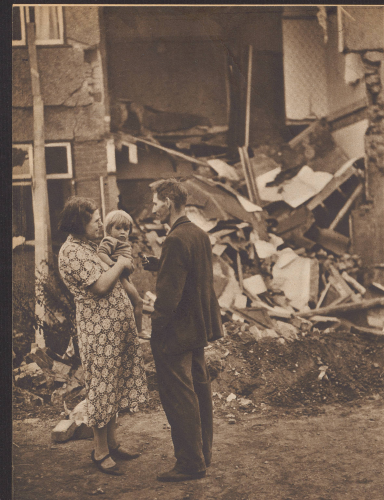
Die Fliegerbombe riß die Wohnstätte dieser kleinen Londoner Familie mitten aus einer Hausruine heraus. Was auch Kato Blut bewahren, den Kopf und den Mut nicht verlieren, trugen von vorn anfangen, arbeiten, erheben, das Selbstvertrauen bewahren und ein bißchen auch in die Hilfsbereitschaft der Menschen glauben. Une bombe a détruit le foyer de cette famille. Que faire? Garder son sang-froid, ne pas perdre la tête et ne pas perdre courage, travailler et encore travailler, avoir confiance en soi et aussi avoir confiance dans l'esprit de solidarité des autres.