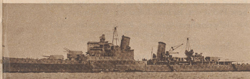
Die «Berwick», ein Kreuzer der «Cumberland»-Klasse, wurde laut italienischer Meldung von zwei Treffern erreicht. Er blieb aber nach englischer Meldung aktionsfähig.

Dans les dernières heures de l'après-midi du 27 novembre, les flottes britannique et italienne se rencontraient au sud des côtes de Sardaigne. Les nouvelles qui nous sont parvenues jusqu'ici sont à tel point contradictoires, que l'on ne peut savoir lequel des adversaires sortit vainqueur du combat.