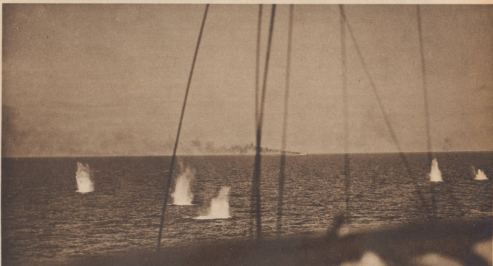
Zu kurz! Eine feindliche Salve landet in guter Richtung, aber zu kurz, vor einem italienischen Kreuzer.