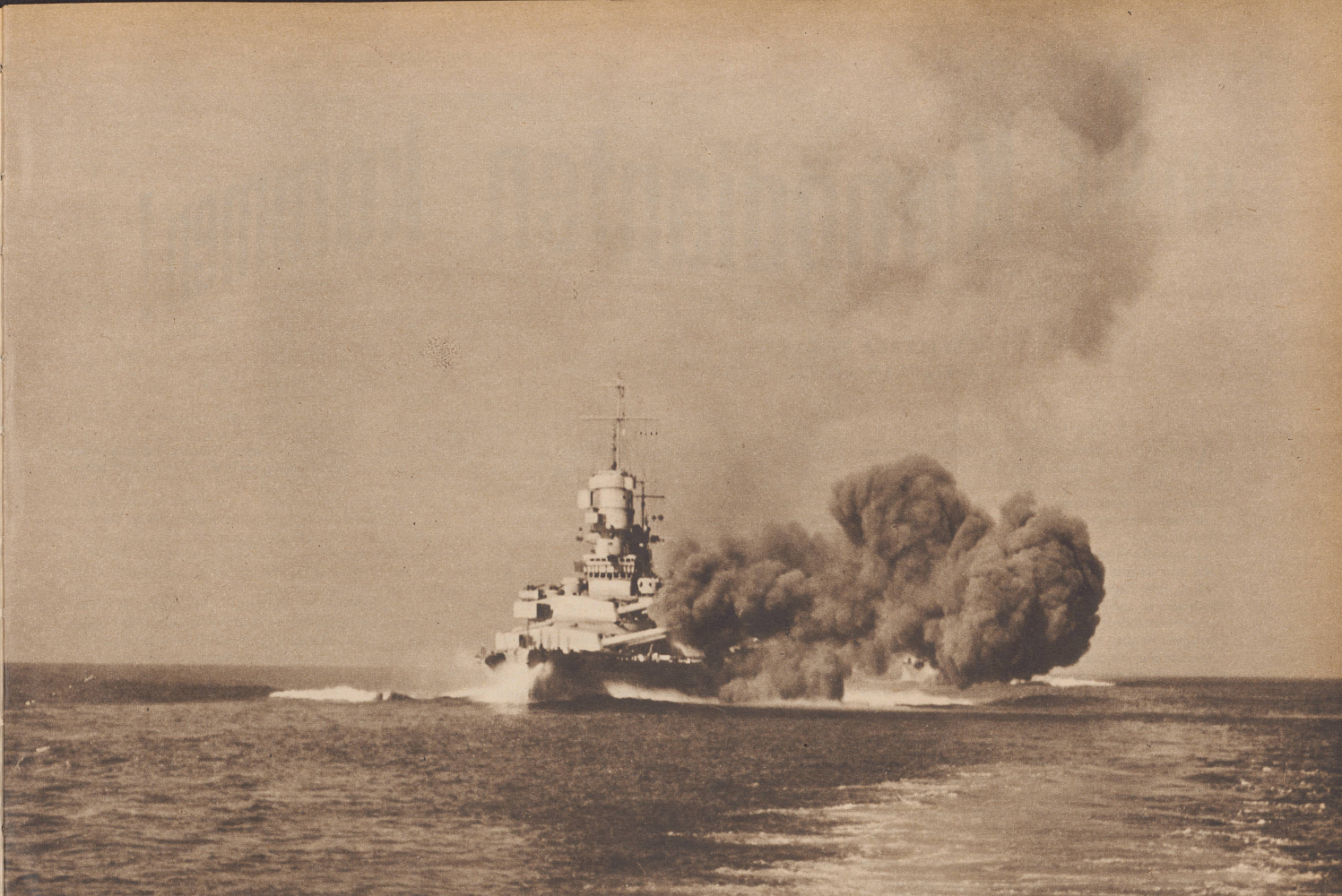
Eine gewaltige Salve des italienischen Panzerkreuzers der «Cavour»-Klasse. Von diesen Kreuzern nahmen an der Schlacht drei Einheiten teil. Außerdem eine große Zahl Zerstörer, von denen der «Lanciere» schwer getroffen wurde, aber noch abgeschleppt werden konnte.