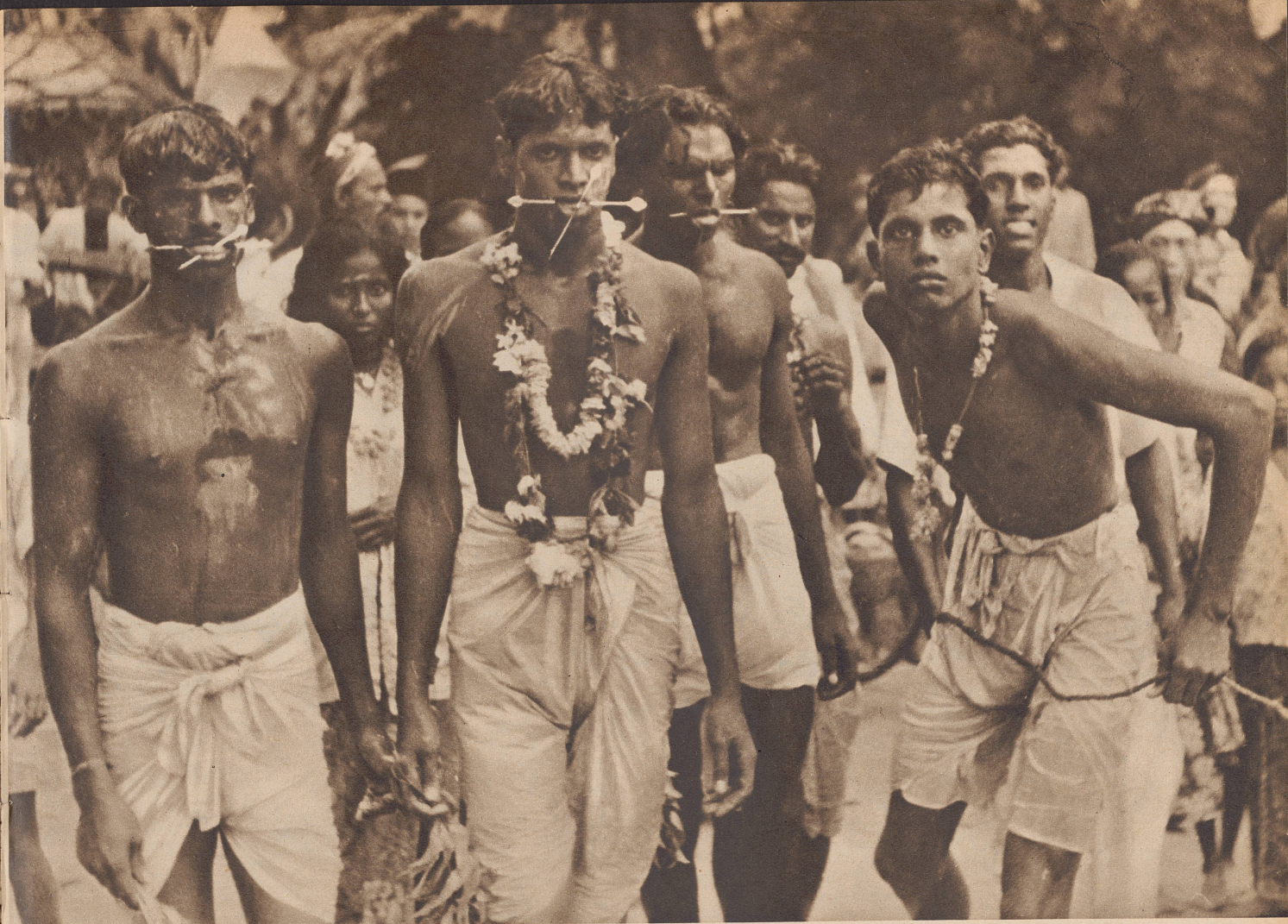
Die Selbsteinigung im Dienste der Religion: Hindus aus Vorderindien bei einem religiösen Fest auf Sumatra. Die Askese spielt bei der Religion der Hindus eine große Rolle. Das eigene Ich wird zurückgedrängt, die Lösung vom Irrwahn des Seins und von den damit verbundenen Gefühlen ist die letzte Bestrebung des Inders.

Dans certaines sectes religieuses d'Afrique ou de l'Inde, telle celle que l'on voit ici dans l'île de Sumatra, darder son visage d'aiguilles, est une pratique courante.