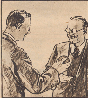
— „Beim Kommandieren muss man noch lauter rufen. Nehmen Sie Gaba, mir helfen sie immer.“ „Ich will es versuchen.“