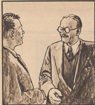
„Sie werden eben gut mit den grossen Klassen fertig. Mich strengt das laute Sprechen zu sehr an.“