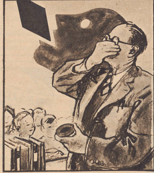
Ich hab's erprobt, und es ist wahr: Ja, Gaba hält die Stimme klar.

Angehörigen und Freunden im Auslande ist die ZI jede Woche ein neuer Gruß aus der Heimat. Bitte, machen Sie ihnen diese Freude. Ausland-Abonnementspreise: Jährlich Fr. 18.35 bzw. Fr. 21.45, halbjährlich Fr. 9.50 bzw. Fr. 11.05, vierteljährlich Fr. 4.95 bzw. Fr. 5.80 je nach Ländergruppe.