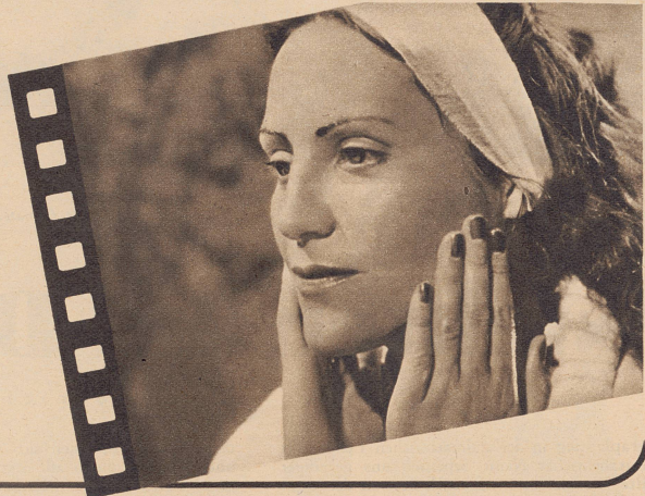
Bild aus dem Hamol-Film, der jetzt in den Kinos läuft.

Im Kino zeigte Ihnen der Hamol-Film wie man den jugendfrischen Teint bis ins Alter hinein erhalten kann