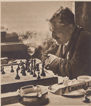
Anlässlich seiner berühmten Partie gegen den nachmaligen Weltmeister Dr. Euwe am Internationalen Turnier von Zürich vom Jahre 1934 (im Kursaal).

Redigiert von Schachmeister H. Grob, Zürich.