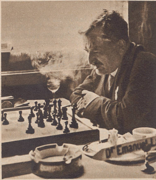
Anlässlich seiner berühmten Partie gegen den nachmaligen Weltmeister Dr. Euwe am Internationalen Turnier von Zürich vom Jahre 1934 (im Kursaal).