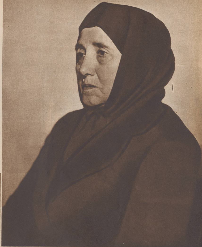
Die Mutter des Präsidenten, eine würdige, vornehme Dame, die sich nach der Mode älterer Frauen mit dem dunklen Kopftuch kleidet.

Chacun, en Turquie, du plus grand au plus petit, connaît le nom d'Ismet Inonu, dont le portrait orne les murs des écoles, des administrations, des commerces, etc. Ismet Inonu, président de la République turque, est le successeur du grand révolutionnaire, Kemal Atatürk qui, avec une volonté et un dynamisme peu communs, construisit sur les ruines du vieil empire ottoman, la jeune et vivante République turque d'aujourd'hui. Ismet Inonu poursuit avec le même courage l'œuvre de son prédécesseur. — Suivant la tradition de la vieille et honorable famille dont il est issu, Ismet Inonu embrassa la carrière militaire et prit part en qualité de général, aux côtés de Kemal Pacha, à la guerre pour l'indépendance de son pays. En souvenir de la victoire remportée en 1921 par les Turques, près de la petite ville d'Inonu, il fut autorisé à porter ce patronyme. Dans ses discours comme dans ses actes, il apporte un grand sérieux et possède à un haut degré le sentiment de sa responsabilité de chef d'Etat. Dans sa vie privée, comme dans sa vie publique, il est un vivant exemple pour tout son peuple.