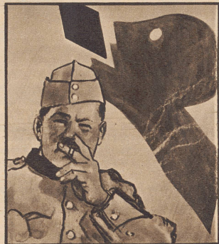
Wer im Dienst ist und gern raucht. Ganz gewiss auch Gaba braucht.