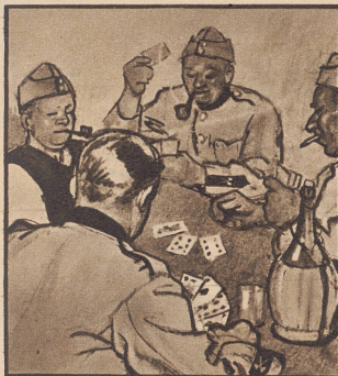
„Das wollen wir unsern Soldaten doch gönnen. Machen Sie es wie ich und schicken Sie ihm immer Gaba mit!“