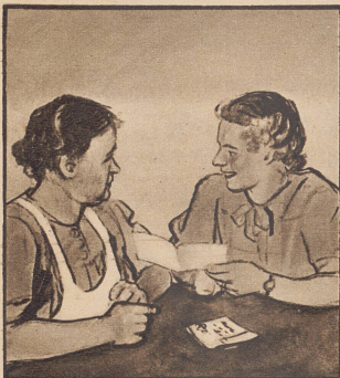
„Warum sind Sie denn so ängstlich, der Bub schreibt doch ganz vergnügt von der Grenze. Er bittet halt um Zigaretten, wie alle.“

Der Holzschnitt mit der menschenleeren Straße und dem Leichenwagen hängt, mit der Unterschrift seines Schöpfers versehen, fortan über meinem Schreibtisch. Er bedeutet mir Mahnung und Auftrag, aus dem Niedergang des Lebens zu retten, was noch zu retten ist.