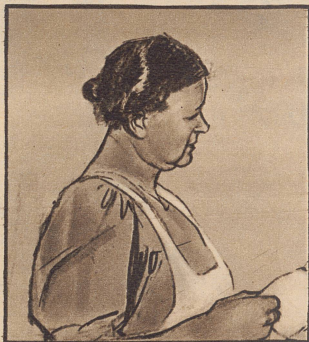
„Ach, wenn er nur keinen Husten kriegt bei dem Wetter... und das viele Rauchen tut ihm auch gar nicht gut.“