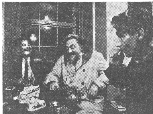
Das Zürcher Original «Walbaum» bei einer Verbrüderung im «Bluetige Duume».

aussehen. Sozialistische Literatur in jeder Menge ist bei Pinkus an der Froschauergasse zu haben. Genossen sagen sich dort du und erhalten das gesamte DDR-Buchsortiment und die Klassiker — Goethe, Shakespeare und so — in vielfach billigeren Ausgaben. Wer eine Gruppe leitet und keine große Bude für die Sitzungen hat, bestellt im «Cooperativ» den ersten Stock. Man fragt dort — im Gegensatz etwa zum «Weissen Wind» — nicht lange nach dem Vereinszweck. Ausserdem kriegt man den Saal gratis, kein Konsumationszwang.