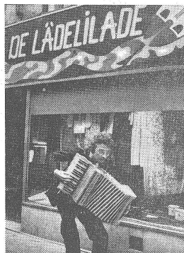
Im Lädelläden chasch mit wenig Chöschte es Agebot vo süßbergmachte Sache poschte; und wänn det das nöd findsch wo d' wotsch, so muesch es asüßbermachen chiline Totsch!