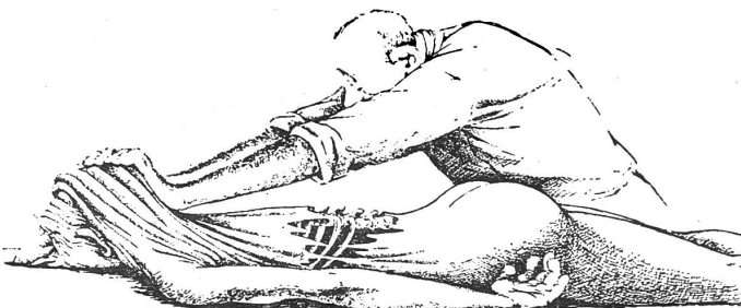
Psychologie: Seelenmassage mit Tiefenwirkung