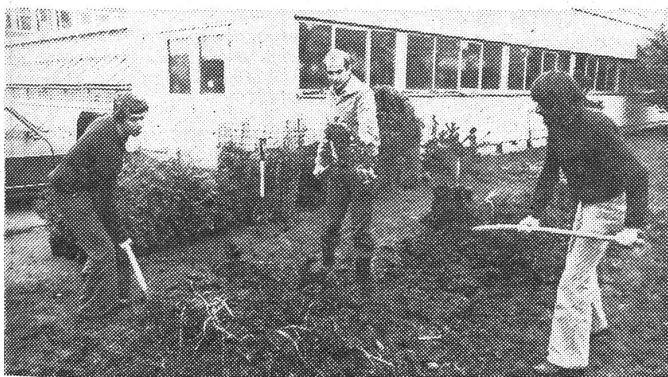
POST: Ein Experiment wurde abgebrochen (II)

EGSTR-Angehörige des Kleinen Delegiertenrats