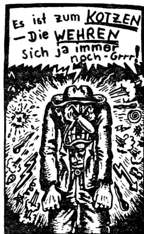
Aus der Essener Studentenzeitung

hungswesen, mit einem Berufsverbot zu rechnen. Und da diese Zürcher Staatsdoktrin – ich muss es betonen – weder in Verfassung noch Gesetz eine Grundlage findet und doch über Jahre dekretiert wird, muss man hier doch schon von einem grossen bisschen behördlicher Ungesetzlichkeit sprechen, welche die Postulate von politischer Freiheit und Verantwortungsbewusstsein in den Wind schlägt und besonders in der akade-