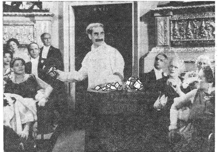
Ein unvergesslicher Opernabend

In «Country Hospital» schliesslich besucht Laurel den verunfall-