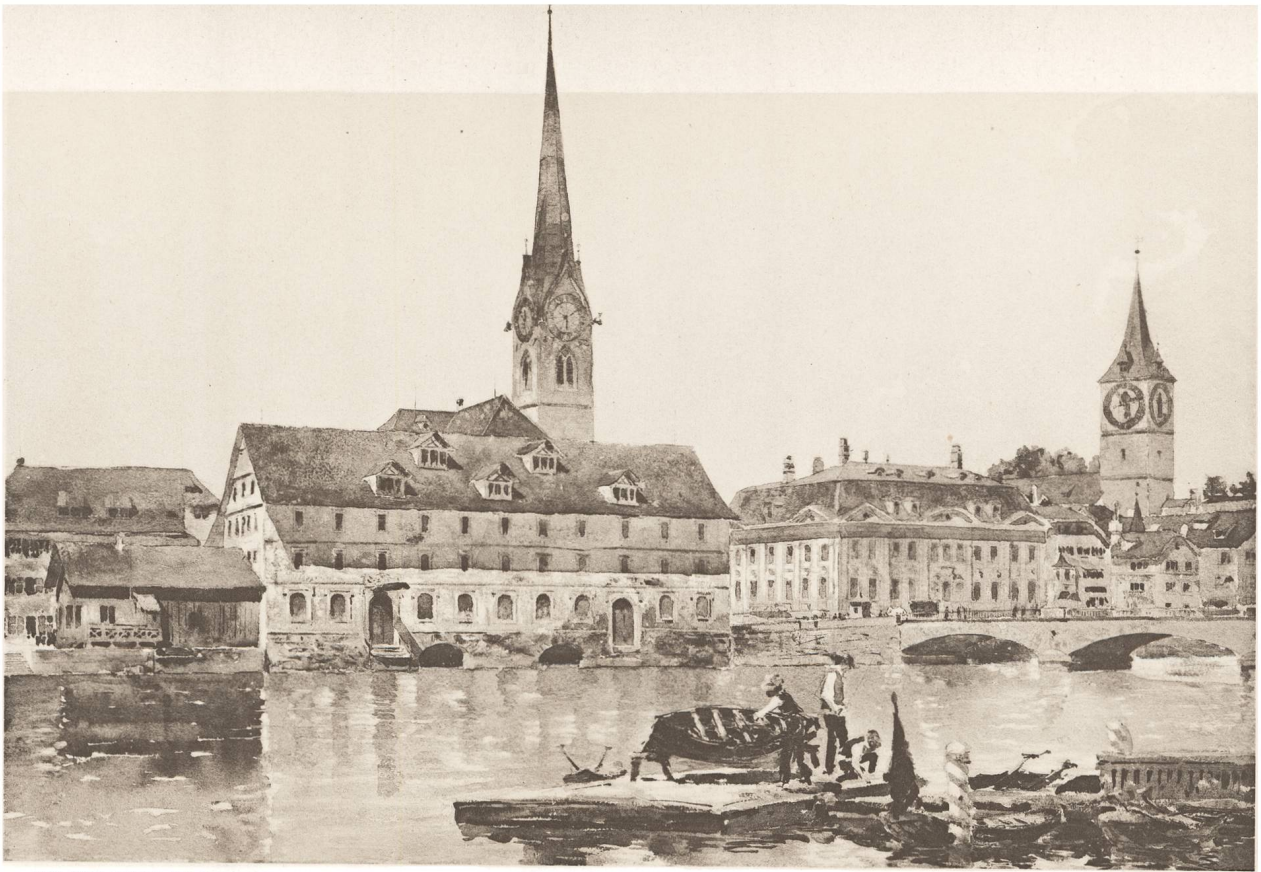
NACH EINEM AQUARELL VON W. LEHMANN.