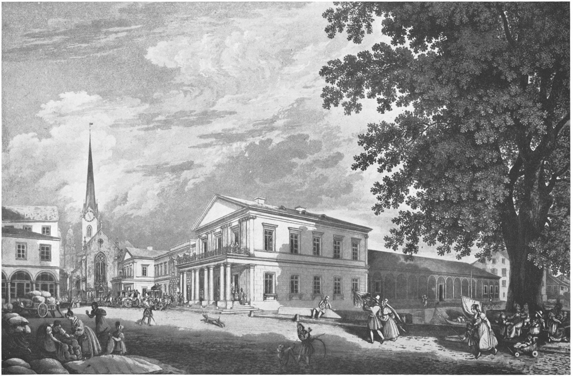
Ansicht des neuen Postgebäudes von Franz Hegi.