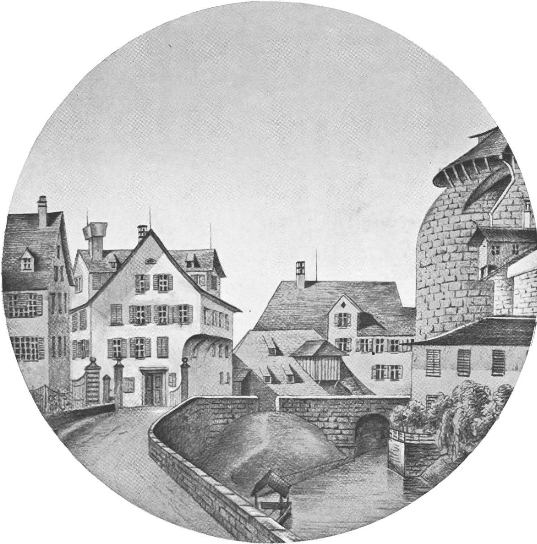
Fröschengraben mit dem Haus zur Trülle.