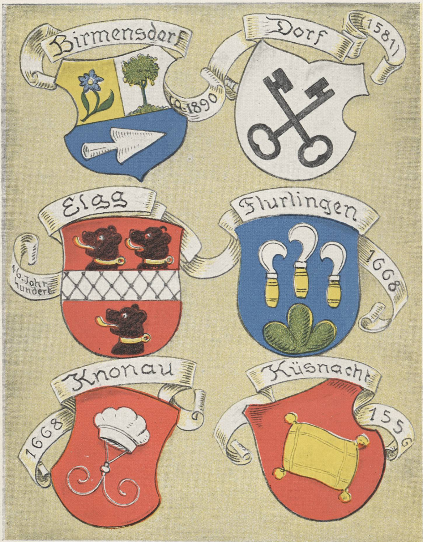
Wappen auf Glasgemälden zürcherischer Gemeinden.