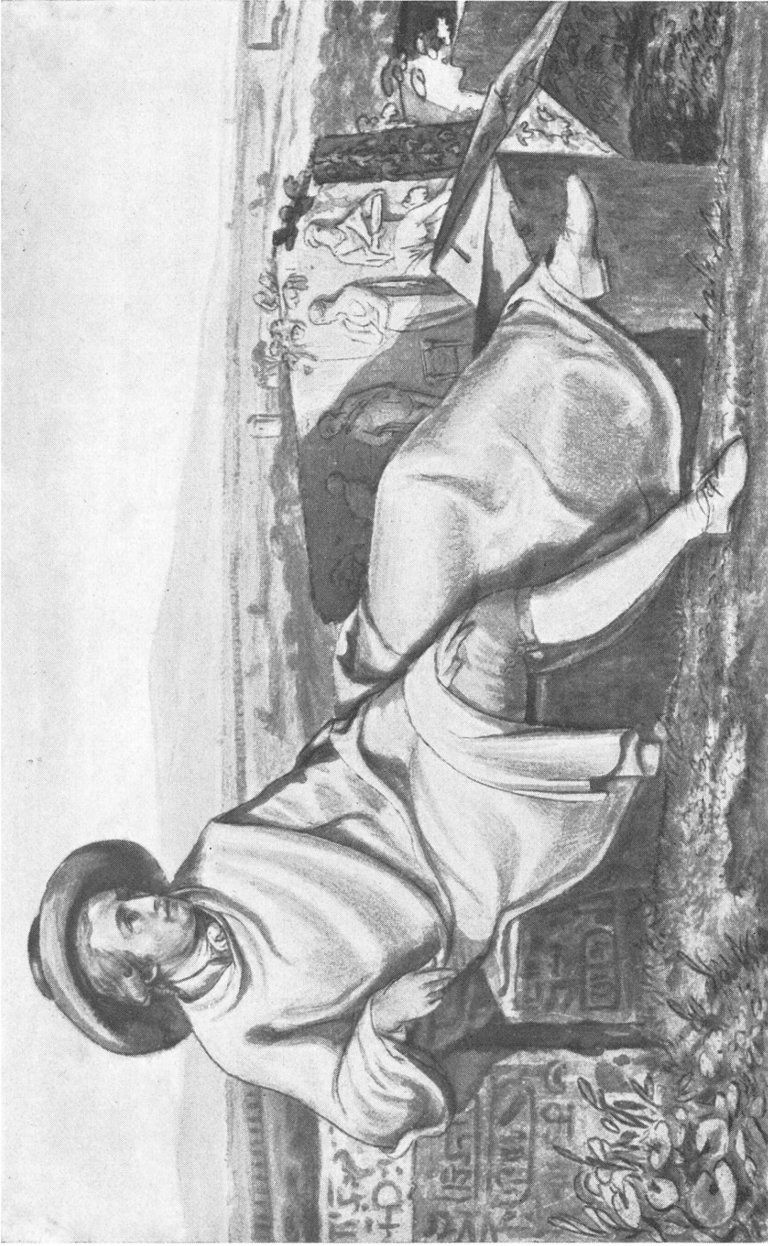
„Goethe in der Campagna“.