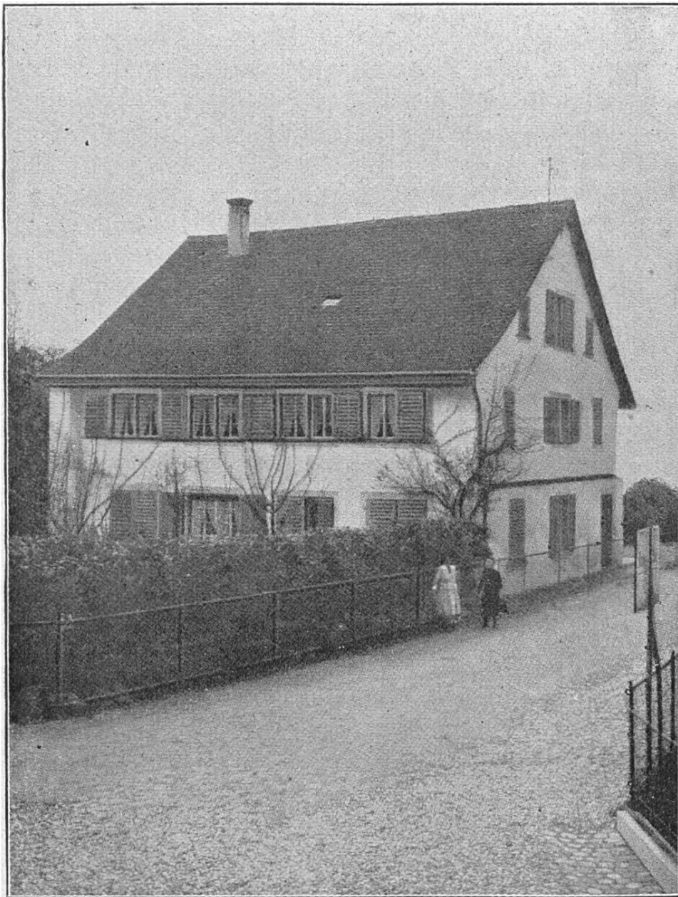
Die 1636 vom Staate erbaute Helferei.