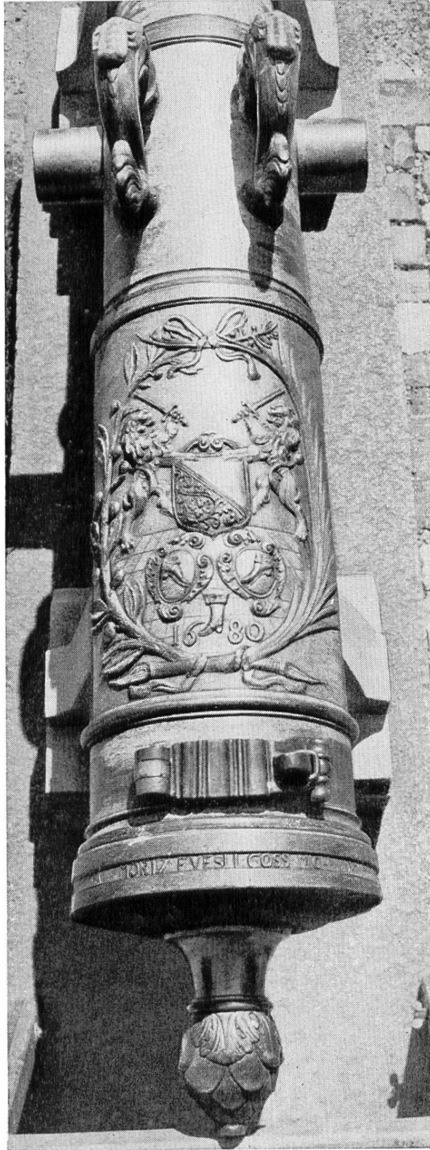
Kartaune der Zunft zur Schuhmachern, 1680