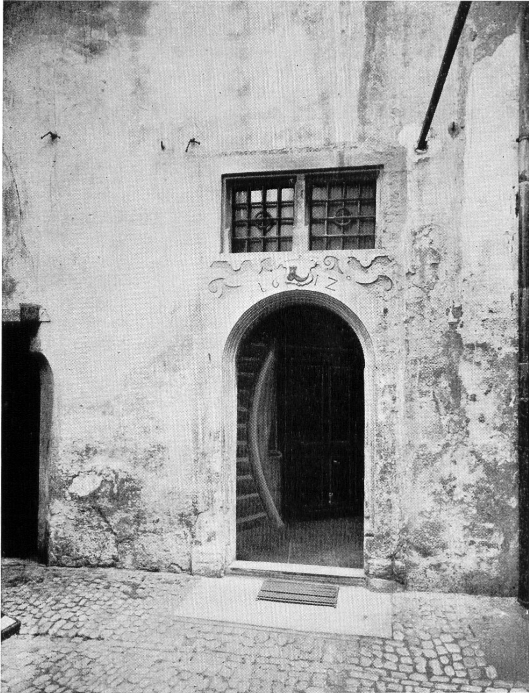
Portal auf der Westseite des Zunfthauses zum hintern Silberschmid