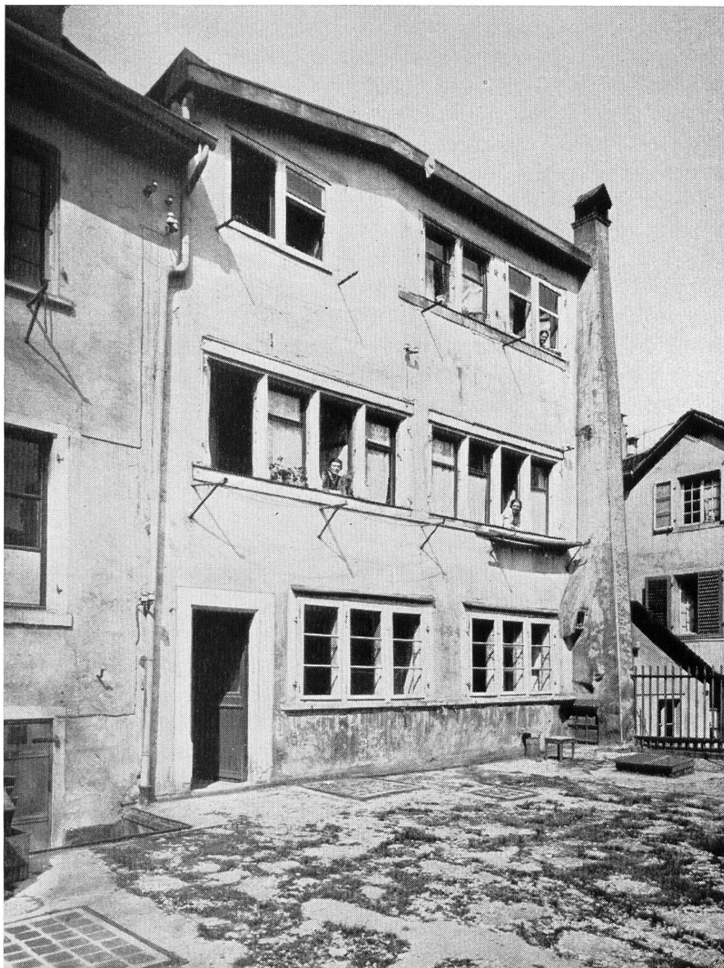
Ostseite des Bunfthauses zum hintern Silberschmid