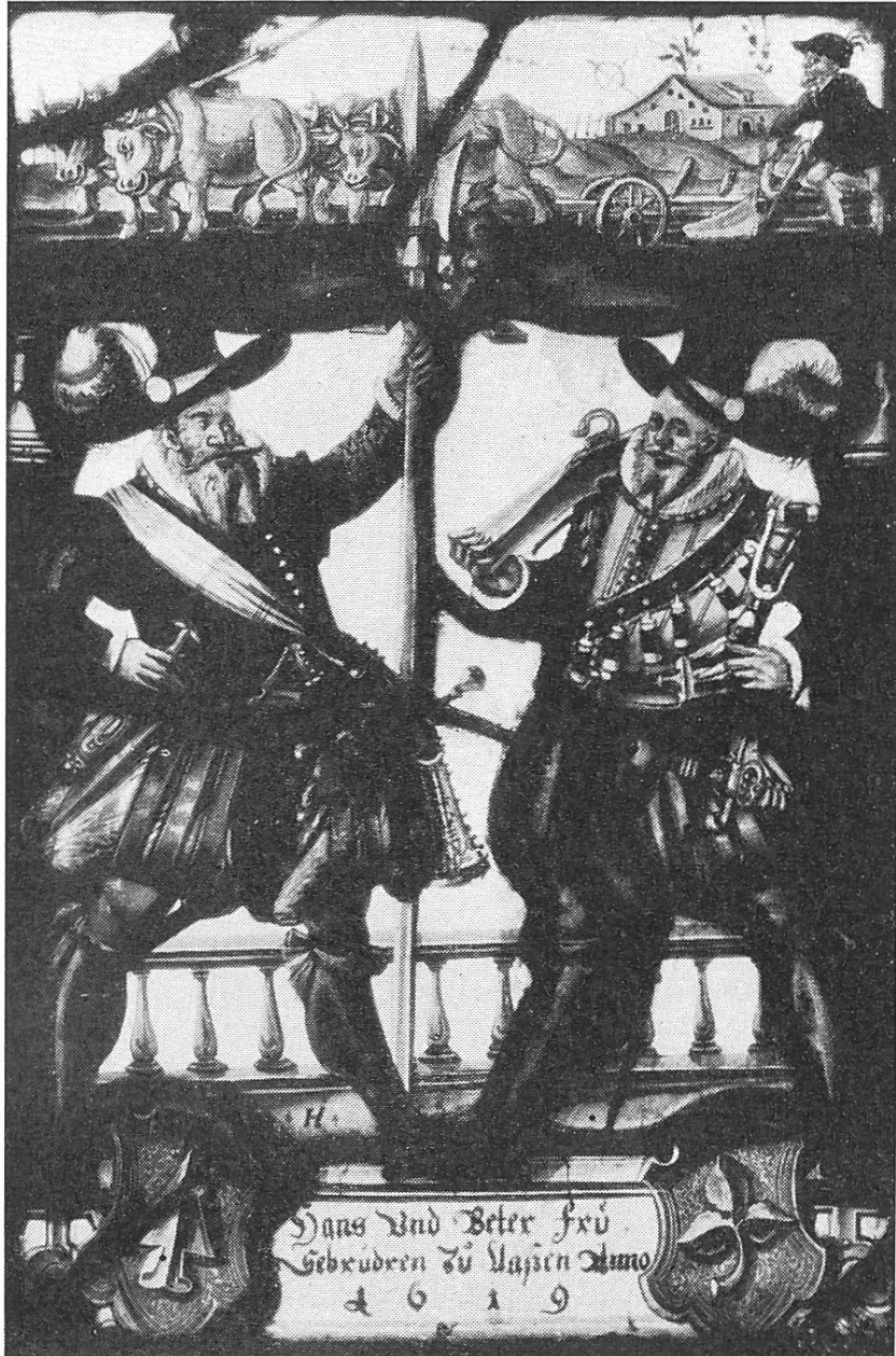
Bauernscheibe der Gebrüder Frue 1619