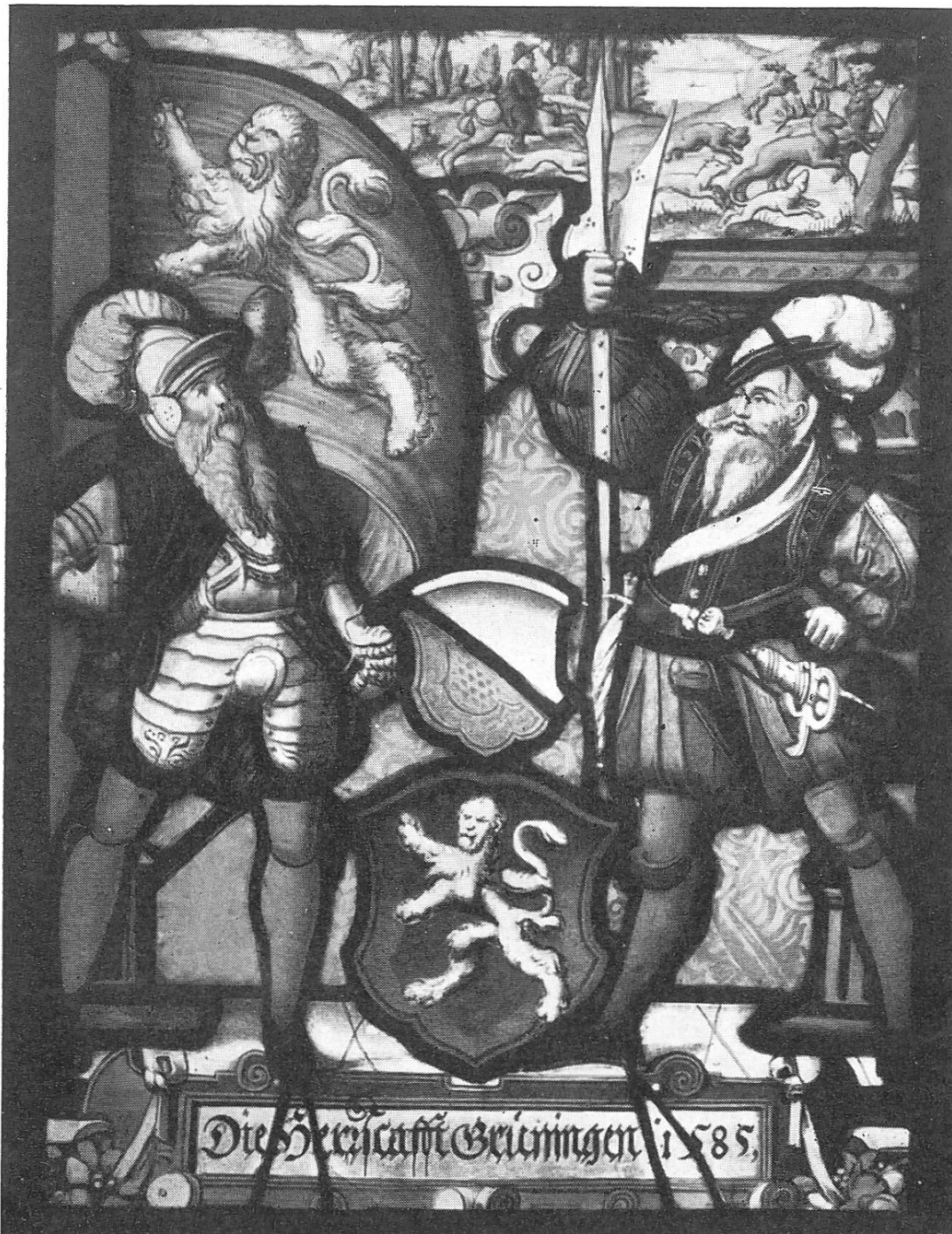
Herrschaftsſcheibe von Grünigen 1585