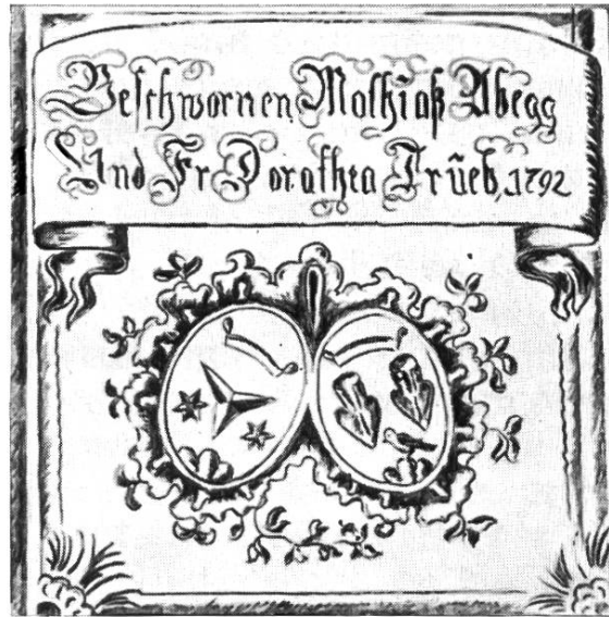
Ofenkachel aus Wiedikon Zweierstraße 176