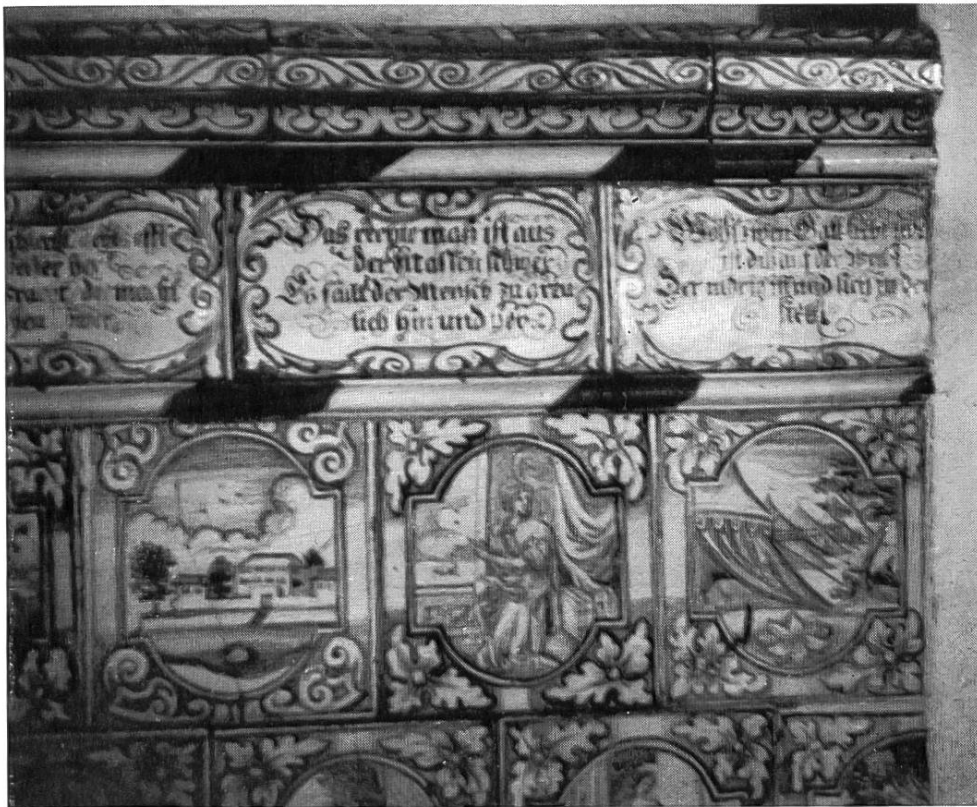
Ofenkachel aus Wiedikon früher Eichstraße 19