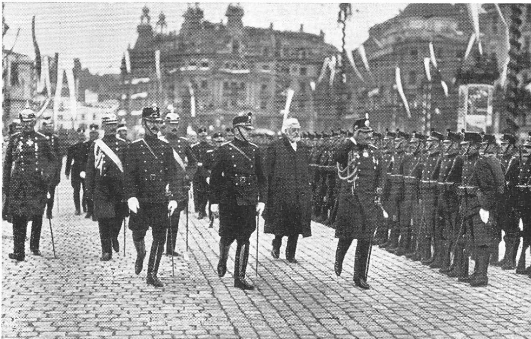
Kaiser Wilhelm II. schreitet die Front der Ehrenkompagnie auf dem Bahnhofplatz Zürich ab