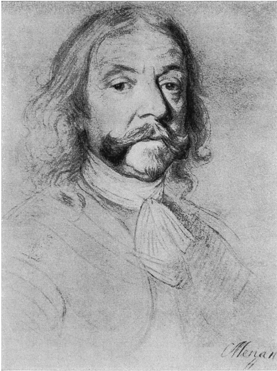
General Johann Rudolf Werdmüller Kreidezeichnung von Matthaeus Merian, 1676