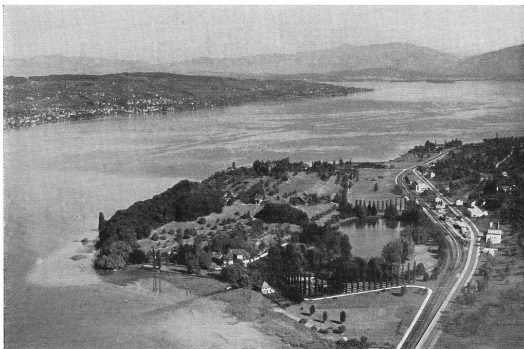
Die Au — heute