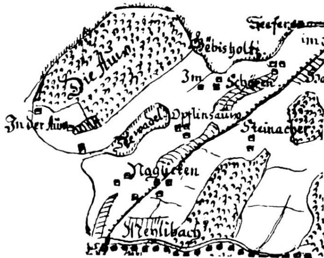
Die Au auf der Gyger-Karte, 1664/67

Die Halbinsel Au darf zum ältesten Kulturgebiet innerhalb der ehemaligen Herrschaft Wädenswil gezählt werden. In der flachen Bucht von Naglikon, nordwestlich des Auseeleins und des Schlossgutes Au, konnten im März 1949 etwa sechzig Meter vom Ufer entfernt Spuren einer Seerandsiedlung festgestellt werden. Professor Emil Vogt vom Schweizerischen Landesmuseum in Zürich hielt als Ergebnis einer Untersuchung im Gebiet des rund siebenzig Meter langen und fünfzig Meter breiten Siedlungsplatzes fest 1 , die grosse Zahl, der Abstand, die Dicke und der Erhaltungszustand der Pfähle sprächen dafür, dass es sich hier um die Reste einer Pfahlbaustation handle. Typisch sind auch die vielen Steine zwischen den Pfählen und die relativ geringe