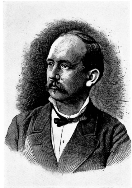
Theodor Curti, 1848–1914 Nationalrat 1881–1902