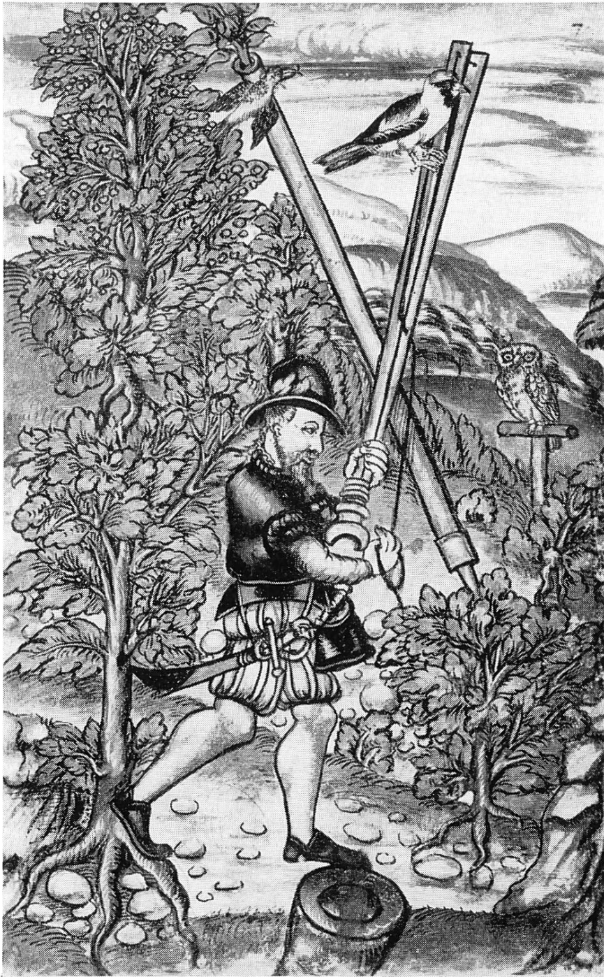
Handhabung des Klobens Im Mittelfeld Fällstange und Lockkauz Von der Ausrüstung des Vogelfängers fehlt die tragbare Laubhütte (Aus Jodocus Oesenbry : Vogelbuch, 1575)