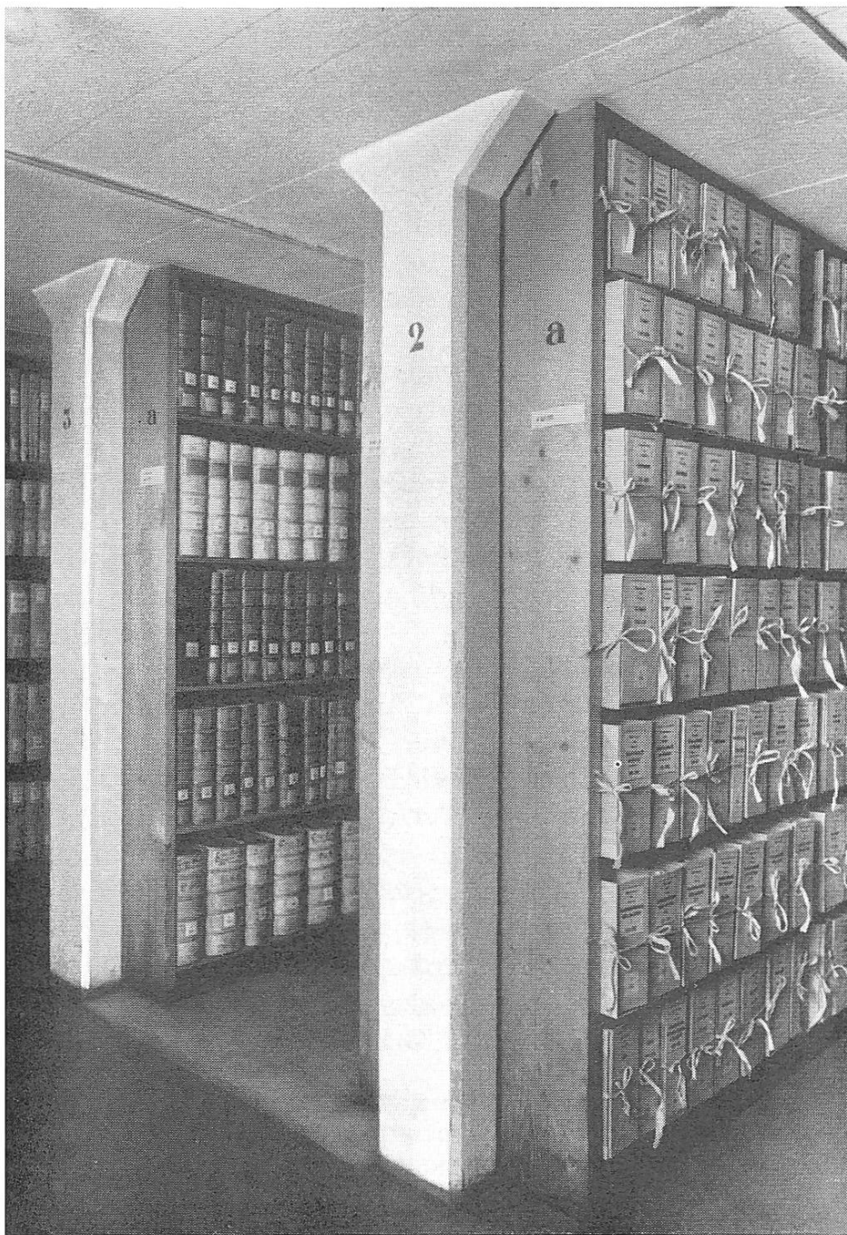
Die Gestelle in den vier Magazingschossen am Predigerplatz bieten Raum für rund 5000 Laufmeter Archivalien.