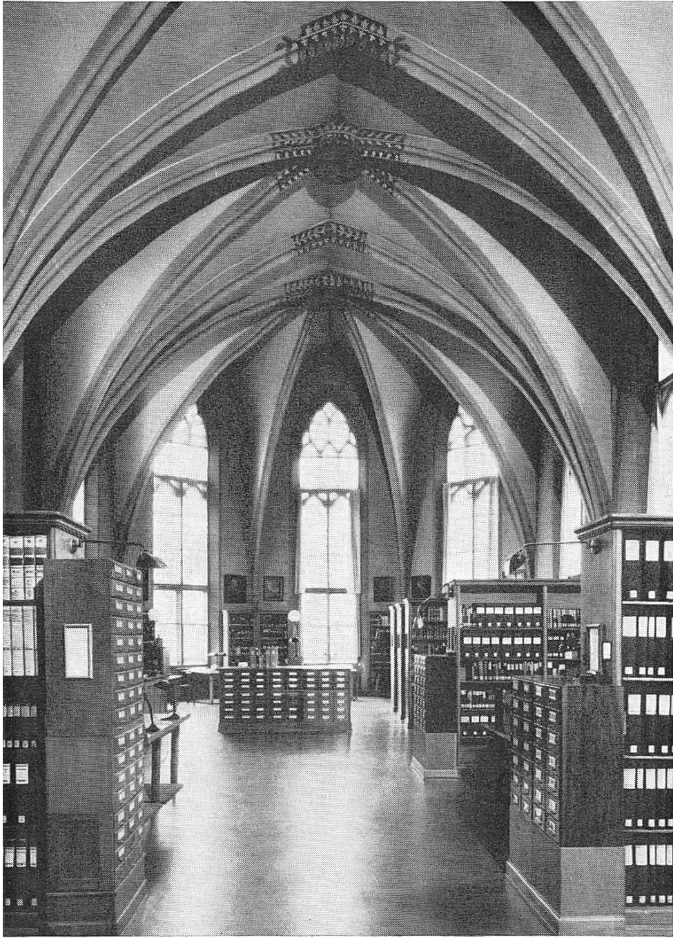
Blick vom Eingang in den grossen Lesesaal im Predigerchor