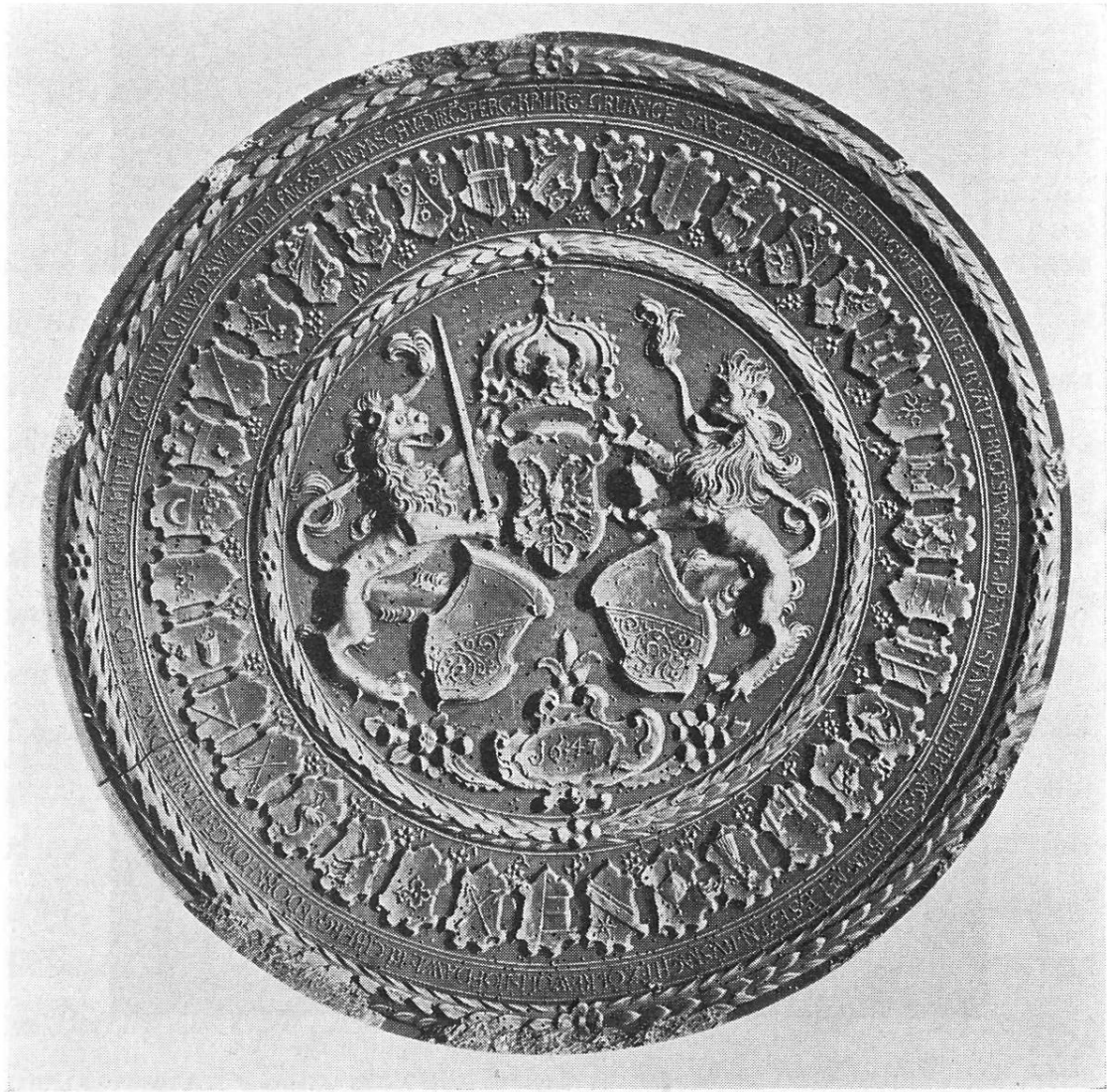
Gebäckmodell aus der Sammlung der Antiquarischen Gesellschaft Zürich im Landesmuseum