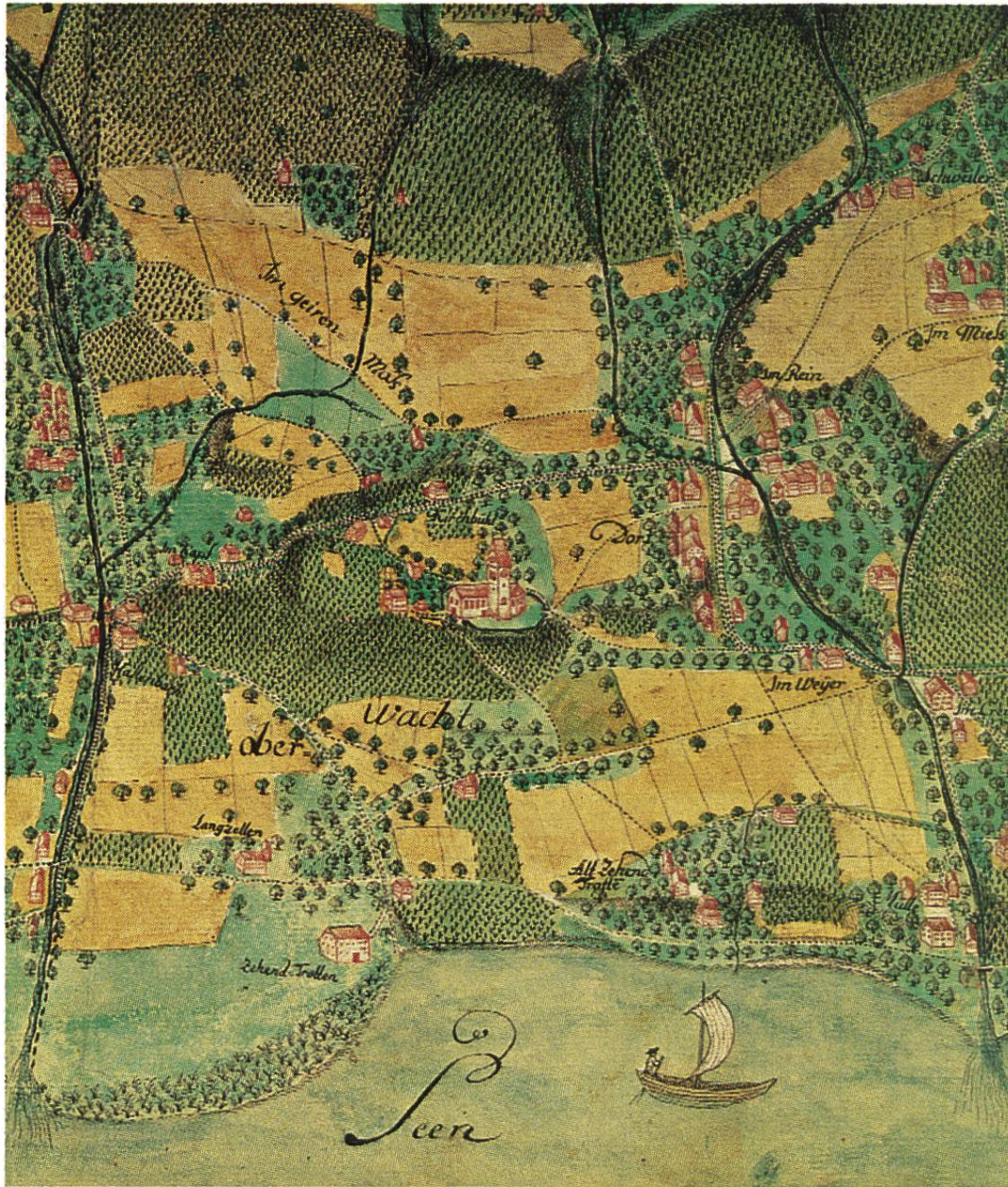
Ausschnitt aus dem «Grund-Riss von der ehrsamem Gemeind Stäffan und sonderlich der Unteren Wacht». Handzeichnung von 1783. Kartensammlung der Zentralbibliothek. Vgl. S. 76