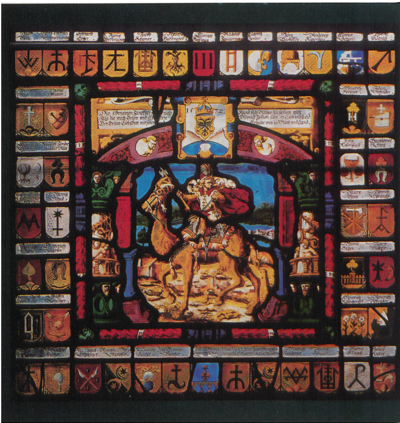
Wappenscheibe der Zunft zum Kämbel des Jahres 1572