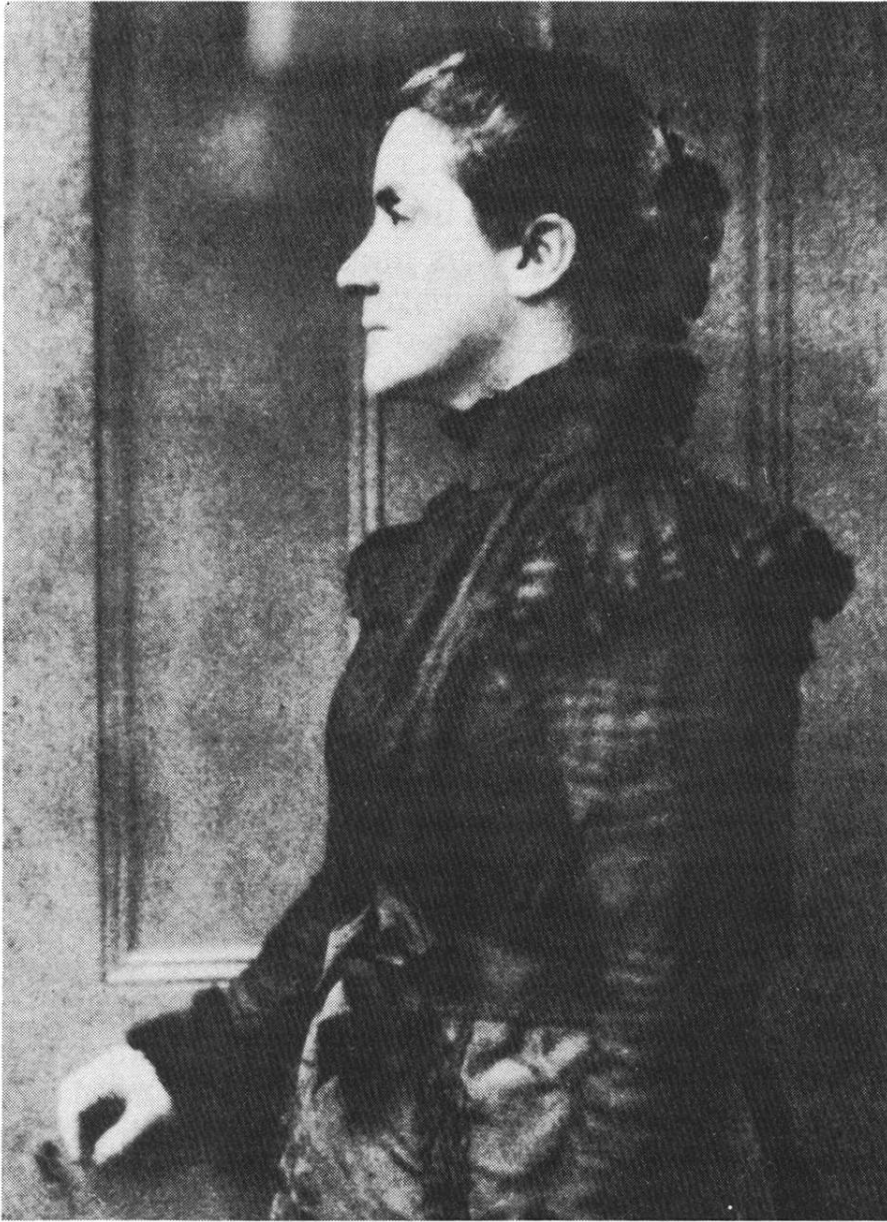
Martha Carey Thomas nach ihrer Rückkehr aus Europa