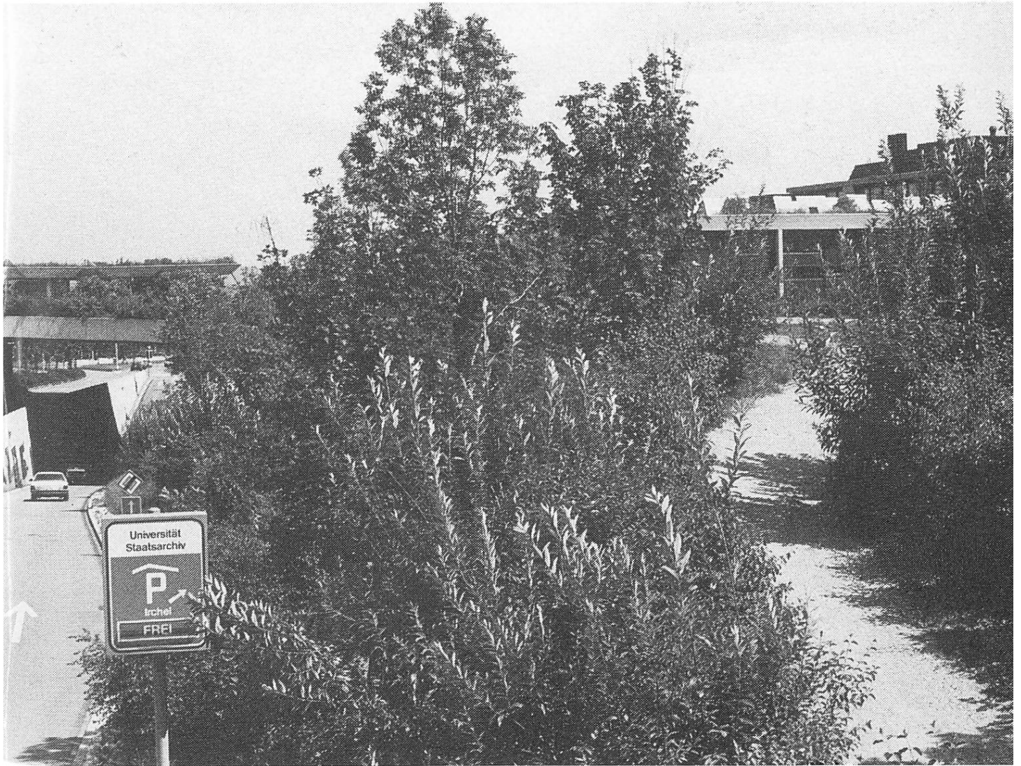
Das Staatsarchiv, noch am Predigerplatz nur wenigen Eingeweihten bekannt, hat sich heute einen Platz im Stadtbild und im öffentlichen Bewusstsein errungen. Hinweistafel Zufahrt Parkhaus, rechts Staatsarchiv im Irchel-Park vor Universitätsgebäuden.