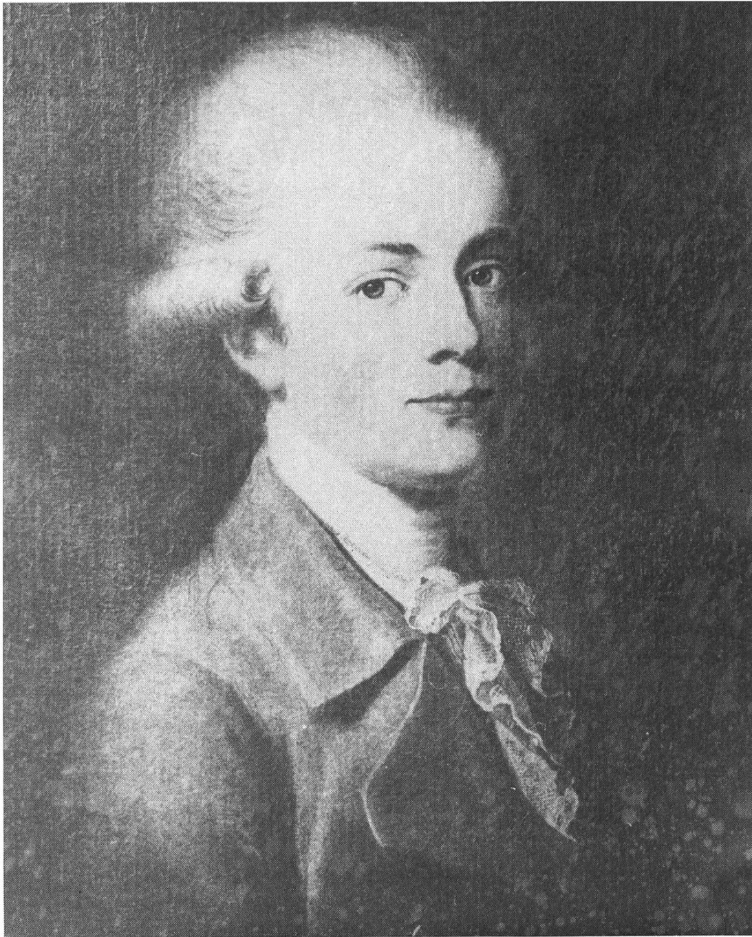
Abbildung 2: Johann Baptist Hofer (1759–1838).