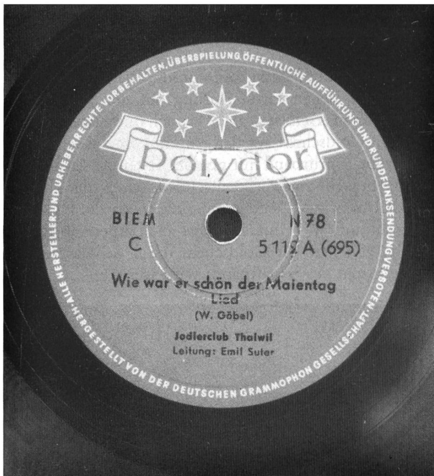
Abbildung 24: Das letzte «Polydor»-Etikett, rot mit Schwarzschrift (1952–56).

Die im Herbst 1945 fortgeführte Aufnahmetätigkeit war sehr rege. Auffallend ist dabei, dass die volkstümliche Musik nicht mehr die gleich dominierende Rolle einnimmt wie vor dem Kriege. Entsprechend dem veränderten Geschmack und Bedürfnis der Käuferschaft fand eine gewisse Verlagerung zugunsten von Schlagermelodien statt.