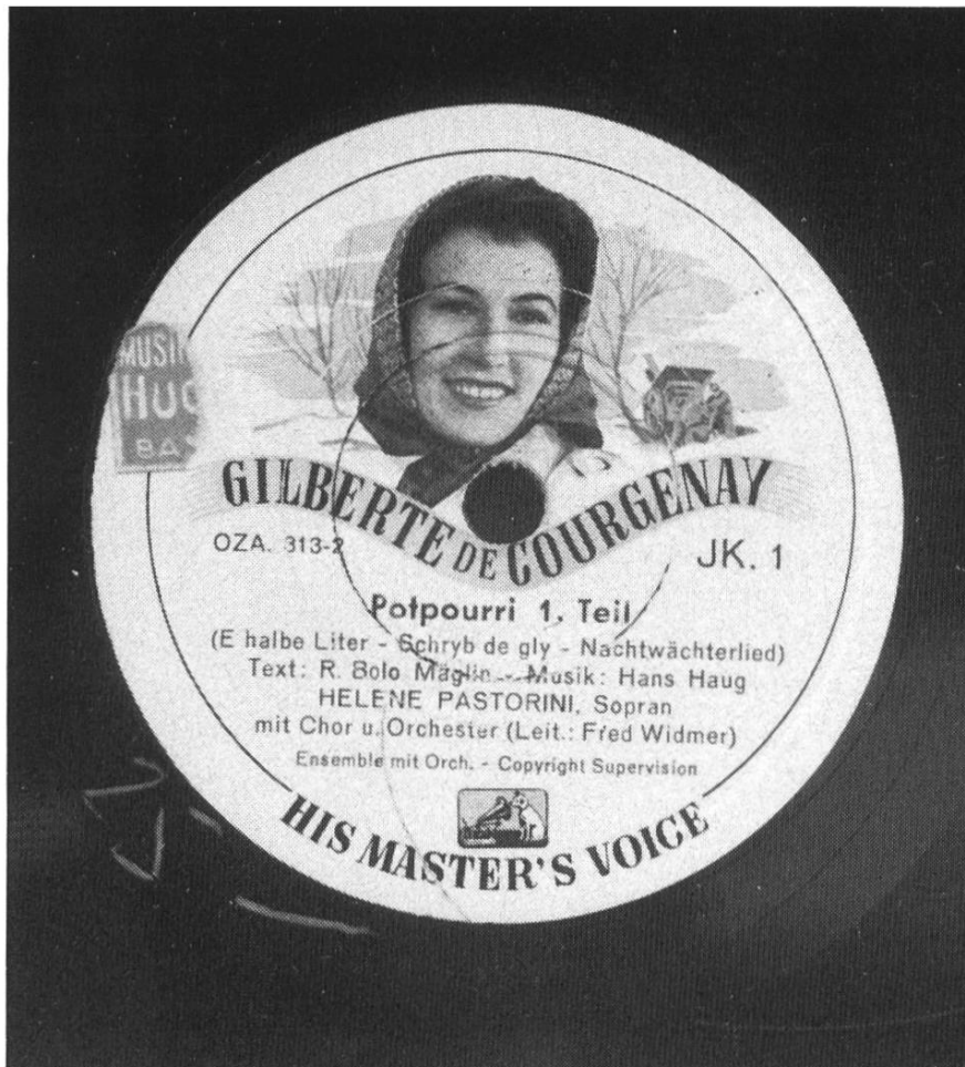
Abbildung 7: Mehrfarbiges Bildetikett der JK-Bestellnummerserie (ab 1940).