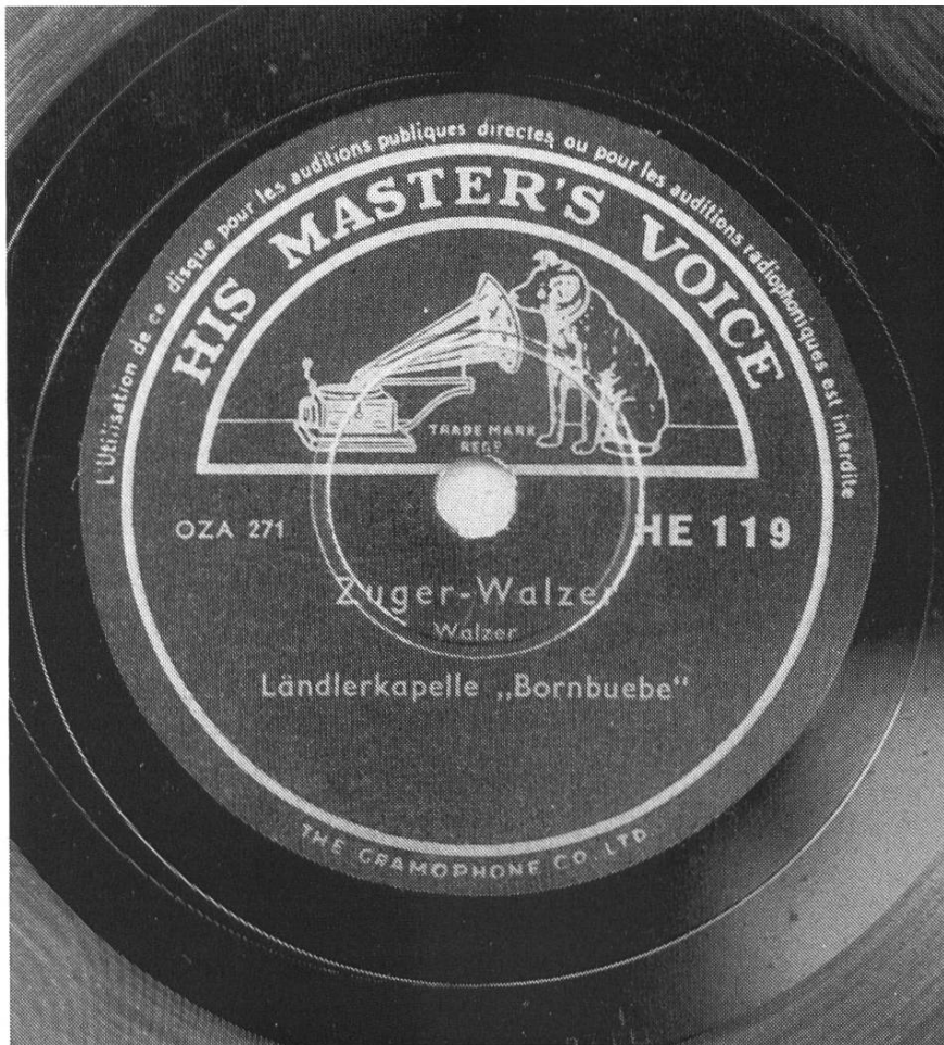
Abbildung 6: Grünes HMV-Etikett der HE-Bestellnummerserie; ohne «Engel»-Schutzmarke (ab ca. 1939).