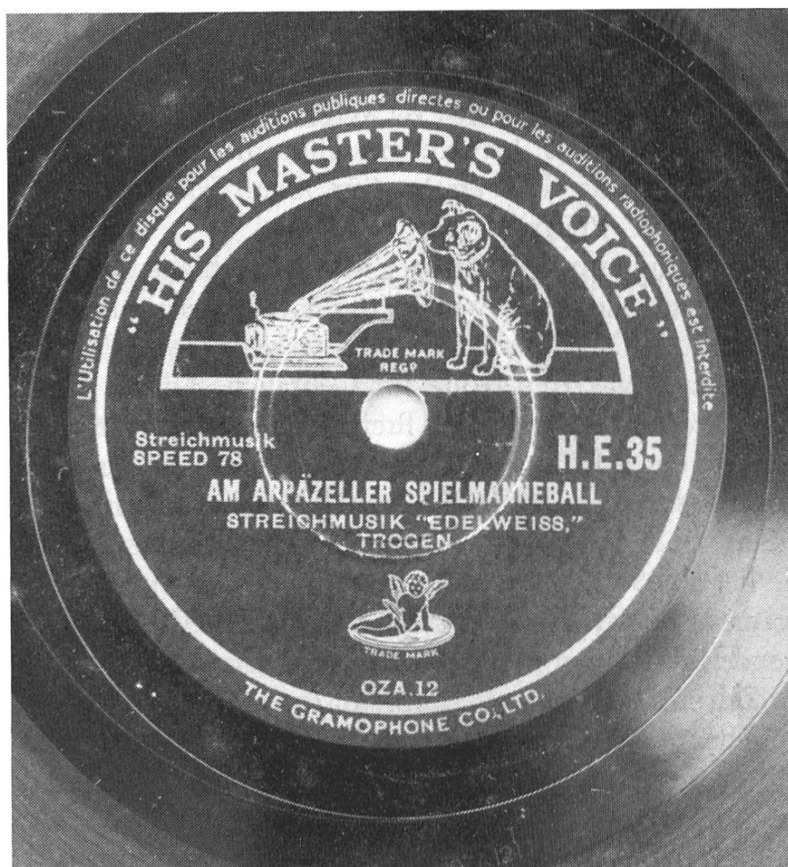
Abbildung 5: Braunes HMV-Etikett der HE-Bestellnummerserie mit «Engel»-Schutzmarke (1937 bis ca. 1939).