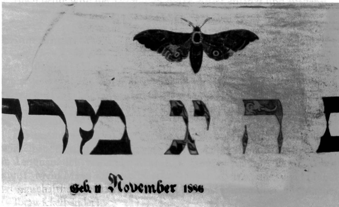
Abbildung 4: Torawickelbänder a) Gesticktes Band, 1726 b) Bemaltes Band, 1886