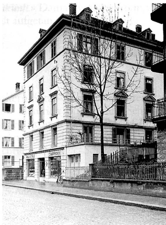
Das Haus Waffenplatzstrasse 17 in Zürich-Enge, das Heinrich Buchmann-Sutz 1895 käuflich erwarb, blieb Wilfried Buchmanns offizielles Domizil bis zu seinem frühen Tod im Jahre 1933 – (Foto aus dem Jahr 1929 – Archiv des Autors)