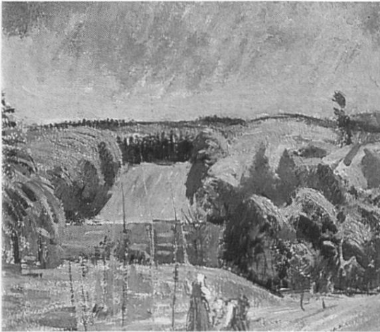
«Rheinlandschaft», (1921), Ölskizze auf Holz (Privatbesitz)