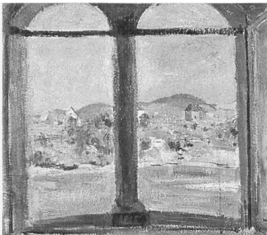
«Bad Säckingen», 1926, Öl auf Leinwand (Privatbesitz)