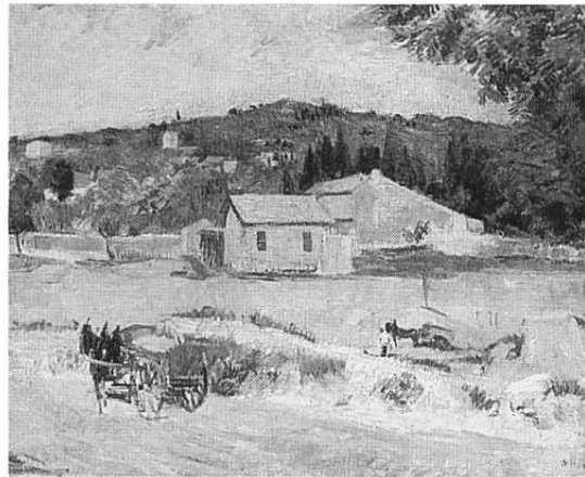
«Provence-Landschaft», 1932, Öl auf Leinwand (Privatbesitz) – (Pendant zur nebenstehenden «Provenzalischen Landschaft» von 1931)