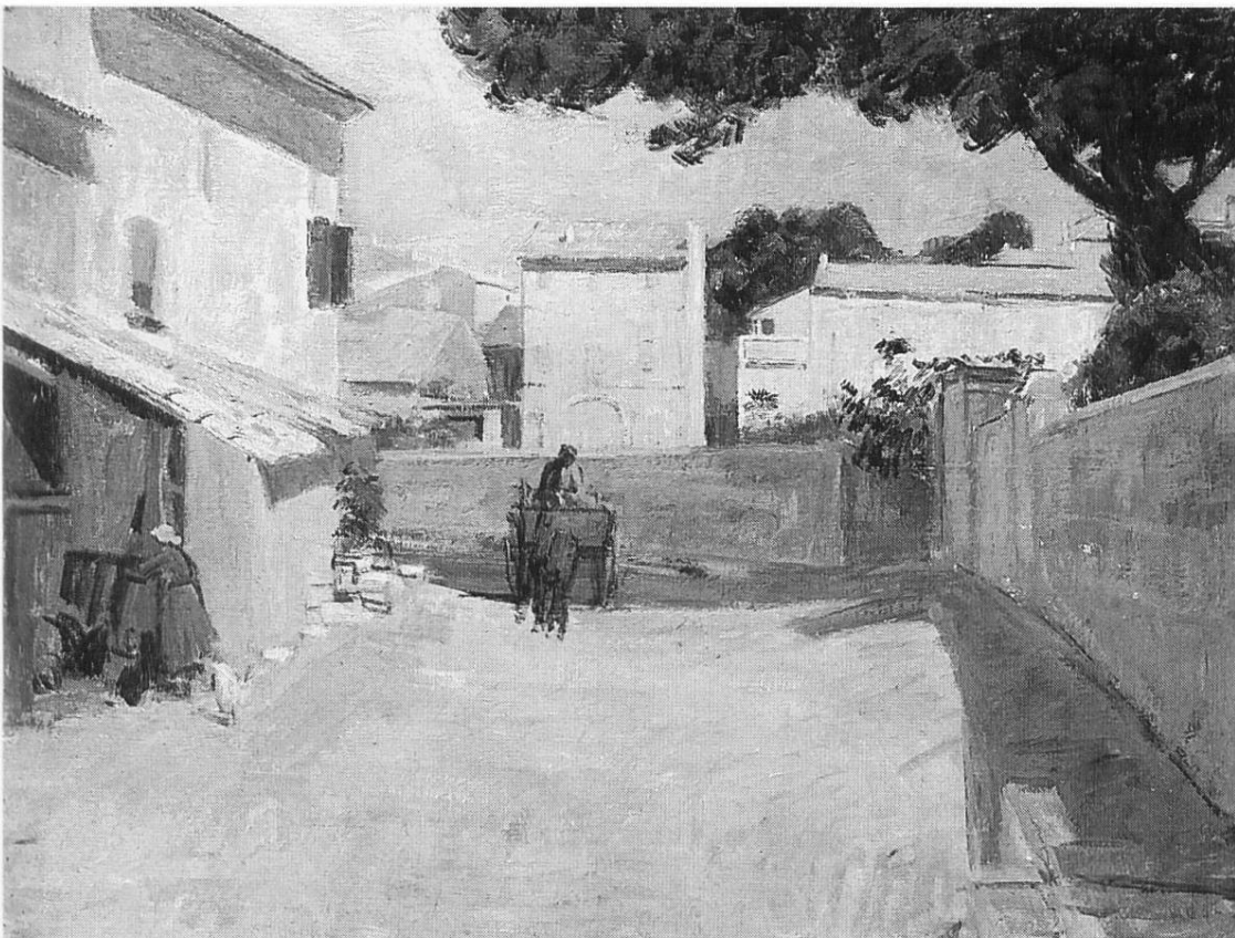
«Strasse in Villeneuve-les-Avignon», 1932, Öl auf Leinwand (Kunstmuseum Winterthur) – (Foto Schweizerisches Institut für Kunstwissenschaft)