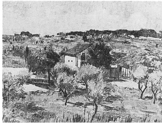
«Olivenhain in Villeneuve», 1932, Öl auf Leinwand (Privatbesitz)