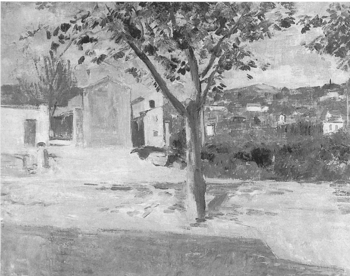
«Provence-Landschaft», 1932, Öl auf Leinwand (Kunsthhaus Zürich)