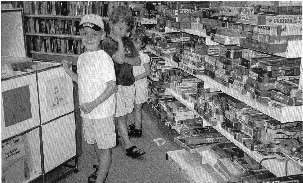
Abb. 3: In der Ludothek der Gemeindebibliothek Thalwil (nach wie vor werden Bibliothek und Ludothek vom Stiftungskapital finanziert).