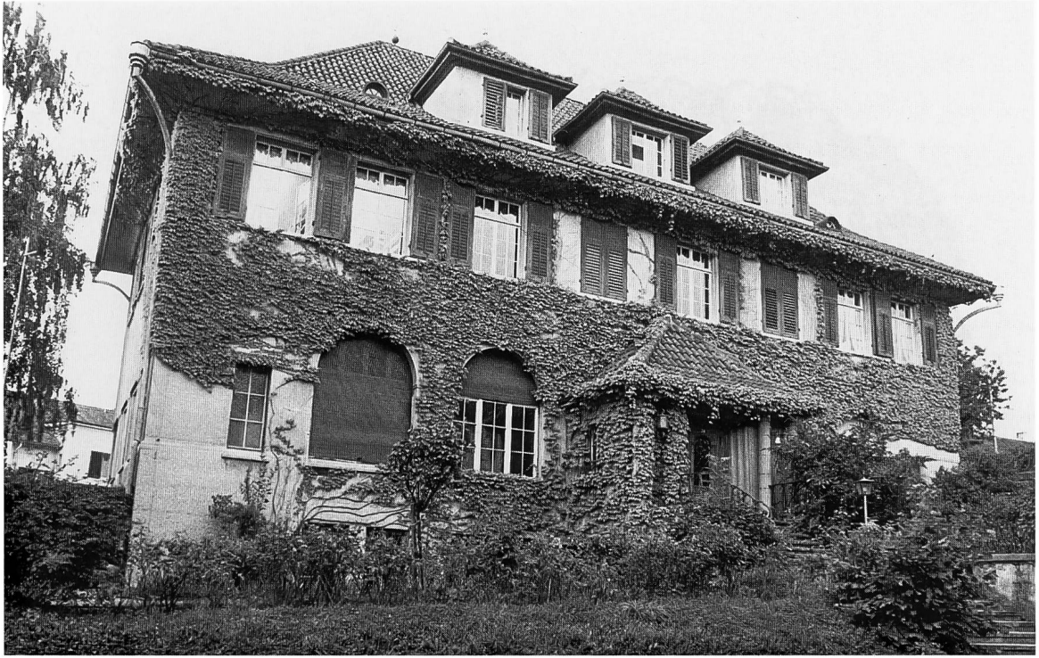
Abb. 1: Der Rosengarten in Thalwil, abgebrochen Mitte der 1970er-Jahren.