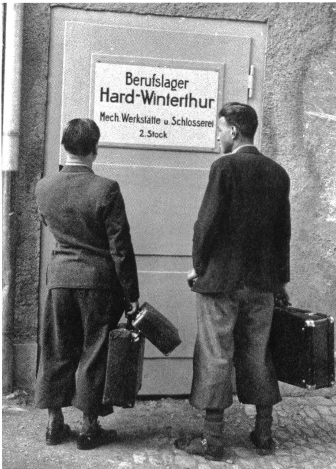
Berufslager in Winterthur als Krisenmassnahme der 1930er Jahre (s. Beitrag Kessler/Akeret).