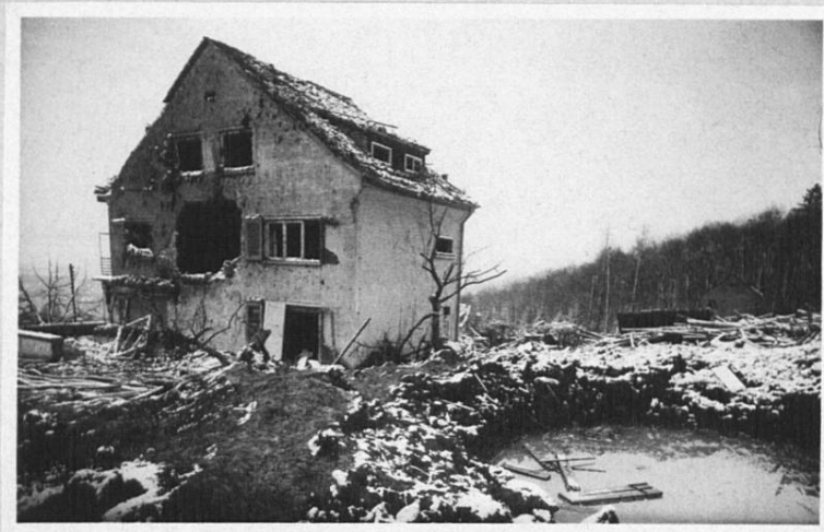
In der Hub Nr. 14, Assek.Nr. 1369. (Haus Pauli)