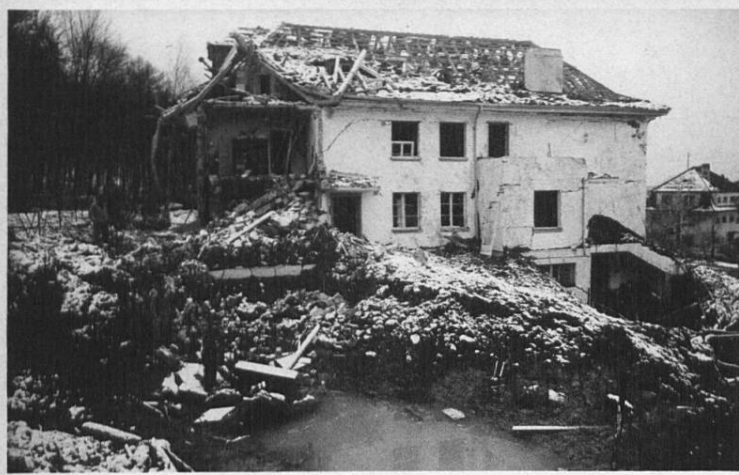
In der Hub Nr. 12, Assek.Nr. 1555, (Haus Bischofberger)