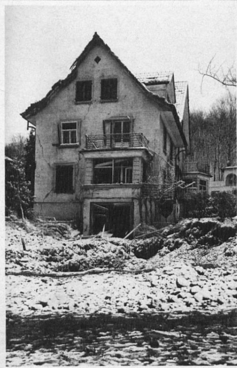
Frohburgstrasse Nr. 174, Assek. Nr. 1336, (Haus Prof. Tank.)