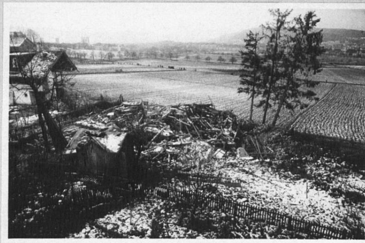
Frohburgstrasse Nr. 186, Assek. Nr. 787. (Haus Kindlimann)