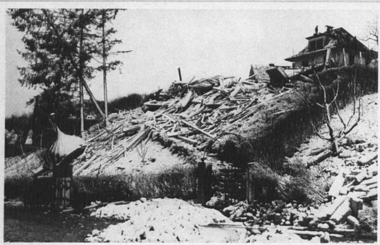
Abb. 2: Stadtpolizei Zürich: Tatbestandsaufnahmen der Gebäude- und Sachschäden, entstanden durch Bombenabwürfe im Strickhofquartier in Zürich 6 am 4. März 1945. (Staatsarchiv Zürich, N1103.1)