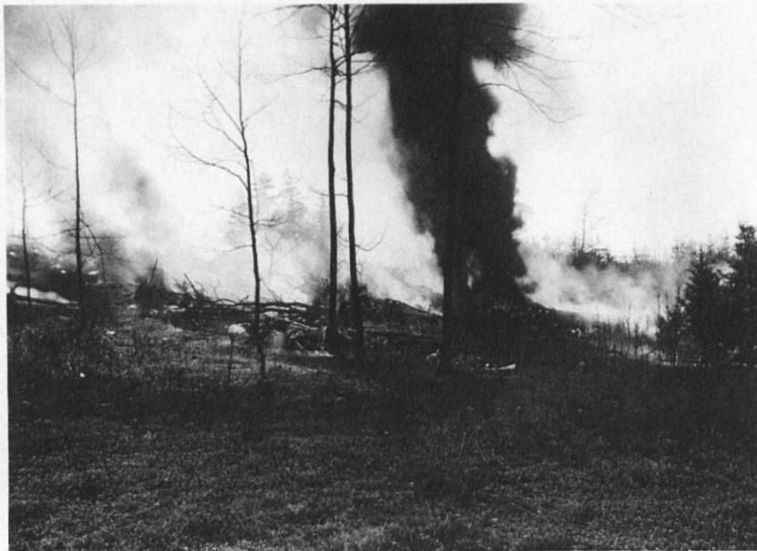
Abb. 5: Absturz eines amerikanischen Bombers am 24. April 1944 bei Baltenswil, Gemeinde Bassersdorf, beim Notlandeanflug auf Dübendorf. Die Besatzung starb in den Trümmern ihres Flugzeuges. (Staatsarchiv Zürich, N1102.3)