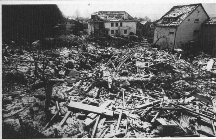
In der Hub Nr. 16, Assek. Nr. 1358, (Haus Stünzi-Maag)