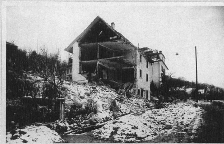
Frohburgstrasse Nr. 184, Assek. Nr. 89 (Haus Honegger/Arnold.)