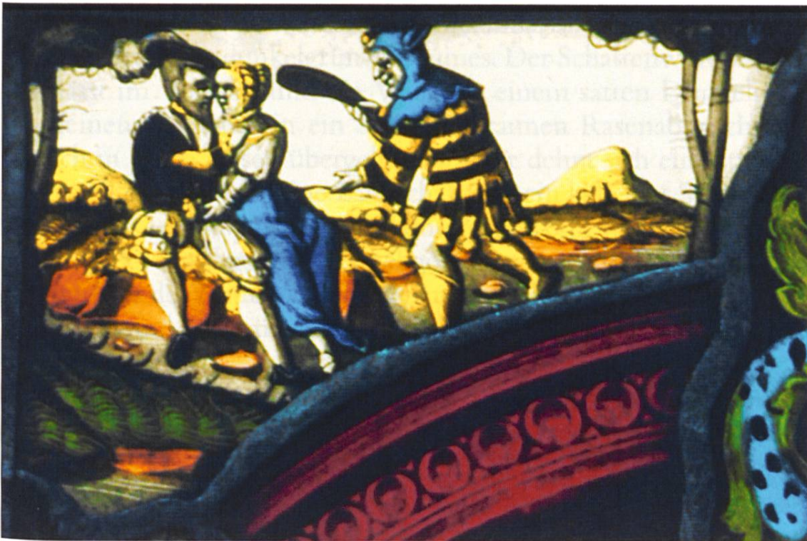
Abb. 7–8 Rechtes und linkes Oberbild der Bickel-Scheibe 1567. (Privatbesitz.)