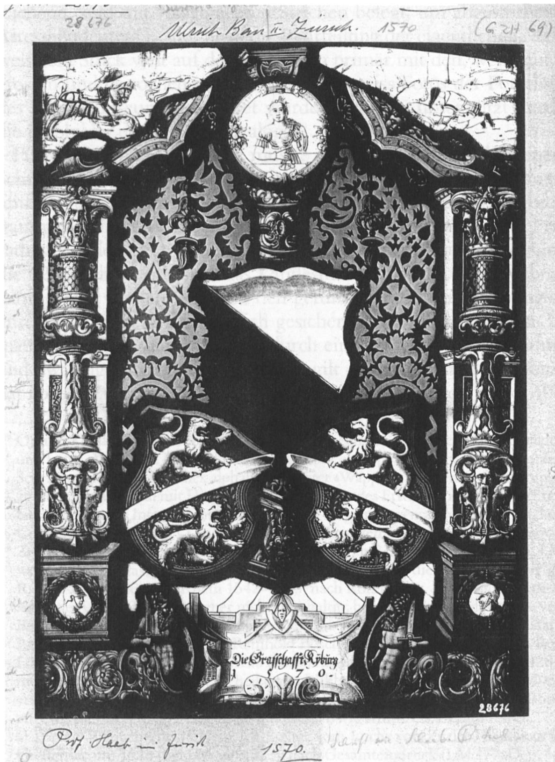
Abb. 5: Grafschaftsscheibe Kyburg von 1570, Ulrich Ban II. zugeschrieben; Typus mit dreifachen Maskarons und Mann mit Schwert vor zwei Blumenranken. (Landesmuseum Zürich, LMNI 28676.)