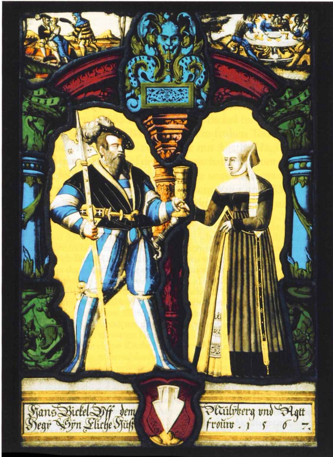
Abb. 3: Bickel-Scheibe von 1567, Ulrich Ban II. (1510–1576) zugeschrieben. (Privatbesitz.)