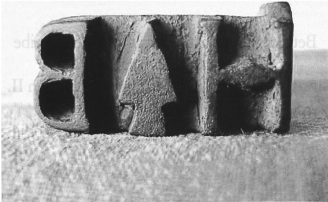
Abb. 1: Brenneisen des Hans Heinrich Bickel, um 1850, Hof Wängi in Herrliberg. (Privatbesitz.)

und 1800 kauften sie die Wängi. Der Hof war allerdings beim Besuch des Autors nicht mehr der ursprüngliche. Der Vorgängerbau war am 4. Dezember 1900 mit anderen verstreuten Gebäuden durch einen Brandstifter vernichtet worden. Einige zum Teil recht alte Gegenstände konnten jedoch gerettet werden, darunter das Brenneisen, das nun dem Autor geschenkt wurde (Abb. 1).