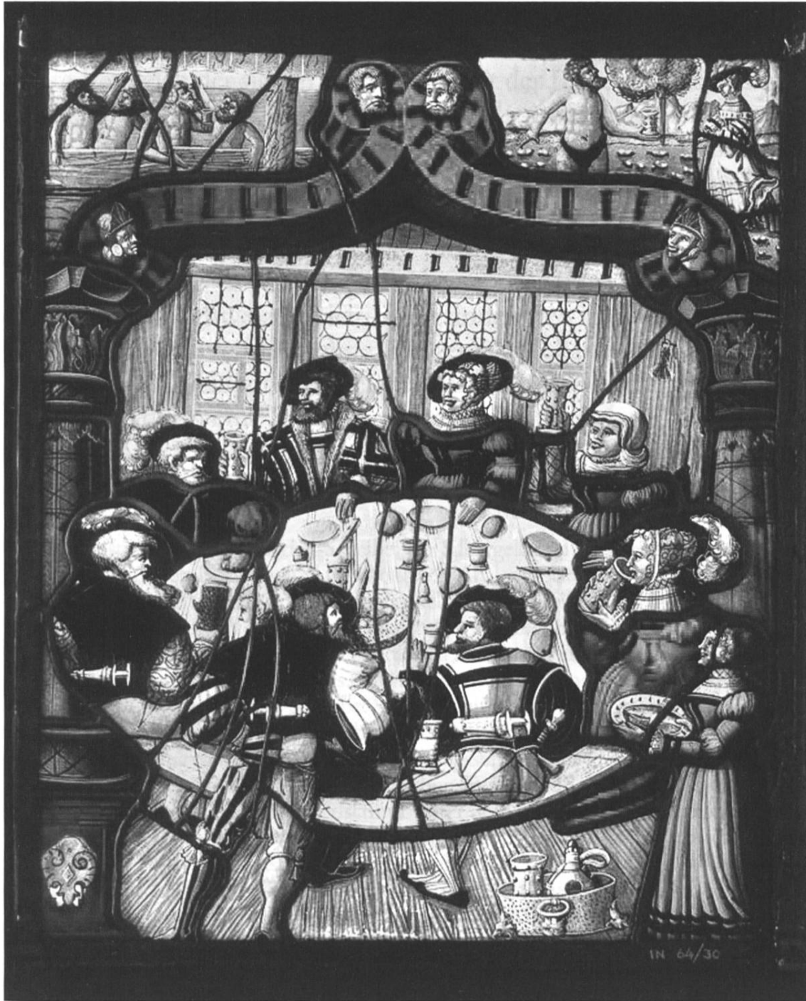
Abb. 4: Signierte Scheibe: Zürcher Badegesellschaft um 1545, Ulrich Ban II. (Landesmuseum Zürich, LM 225.)