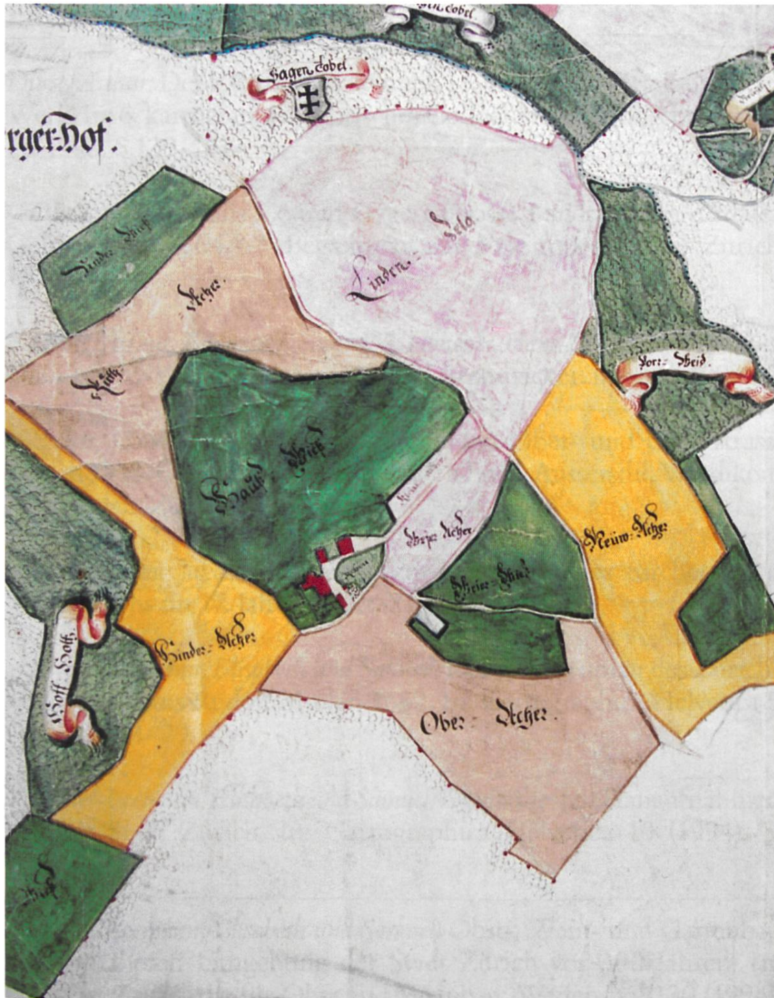
Abb. 5: Zürichberghof, Zehntenplan des Obmannamtes, Ausschnitt: Die drei Zelgen, gelb, braun und hellviolett, die Wiesen dunkelgrün und der Wald nur angedeutet mit braunen Ringlein. Das Lehenshaus, das ursprünglich ein Teil des Klosters St. Martin war, ist heute die «Wirtschaft zum alten Klösterli» hinter dem Zoologischen Garten. Staatsarchiv Zürich, PLAN B 439.