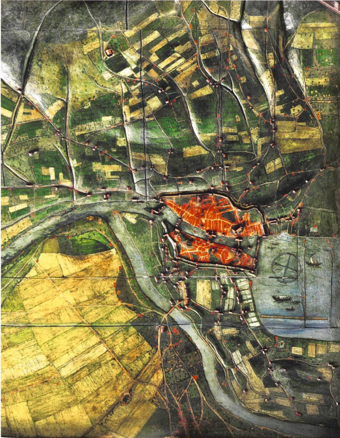
Abb. 1: Reliefmodell der Stadt Zürich und ihrer näheren Umgebung 1627. Massstab 1:3200, 165 x 137 cm. Foto Schweizerisches Nationalmuseum, SLM KZ-5625.