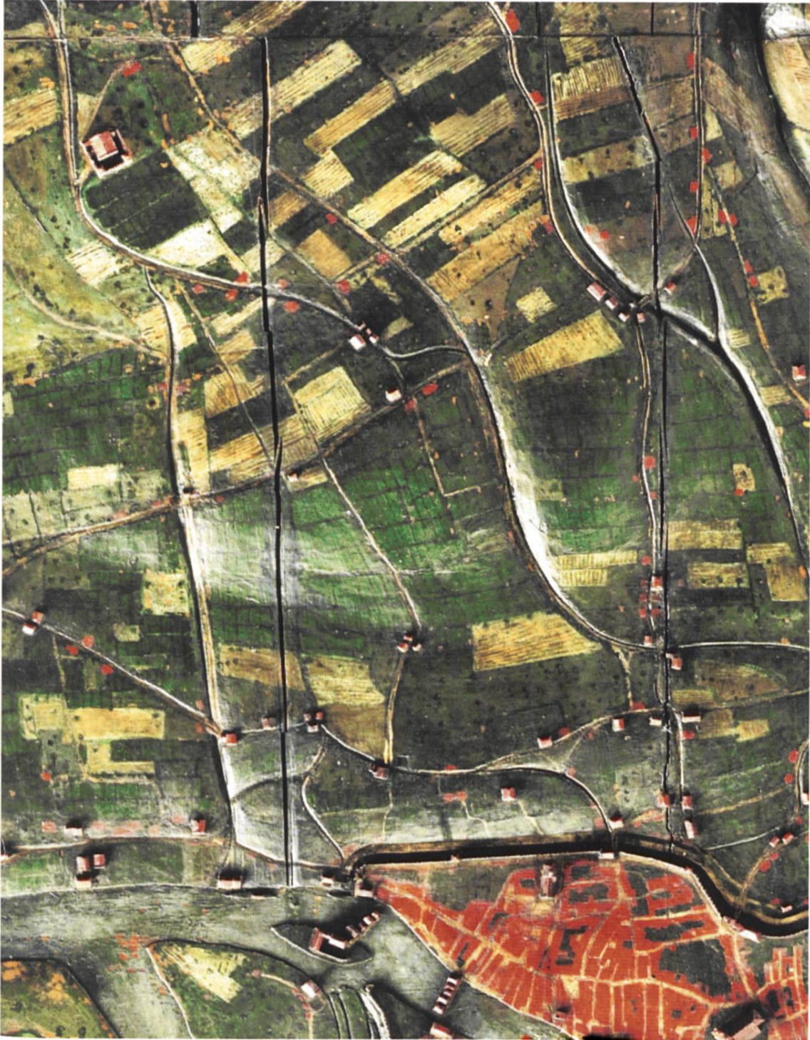
Abb. 4: Reliefmodell 1627, Ausschnitt Fluntern, Oberstrass, Unterstrass.