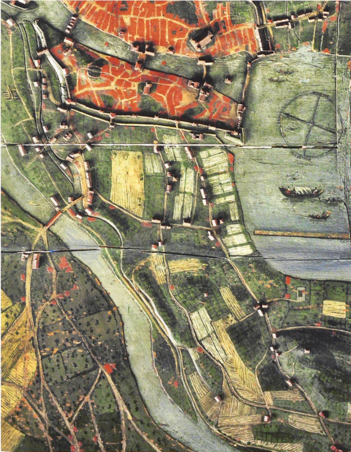
Abb. 3: Reliefmodell 1627, Ausschnitt Enge, Selnau, Aussersihl.