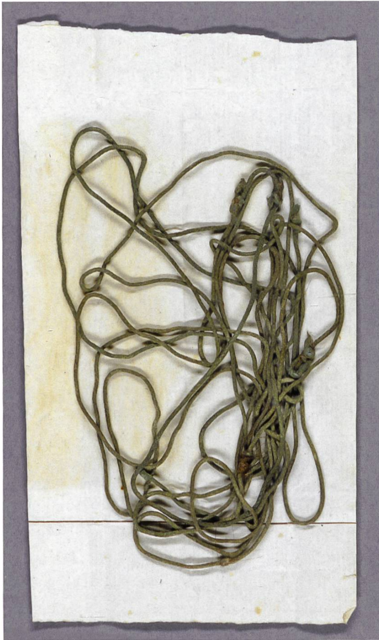
Eine «grünseidene Haarschnur», im Staatsarchiv Zürich bei den Akten liegend betreffend eine mutmassliche Kindstötung im Jahr 1778. Wohl das älteste Corpus Delicti in den Zürcher Archiven. Siehe zum Fall den Beitrag von Meinrad Suter in diesem Taschenbuch.